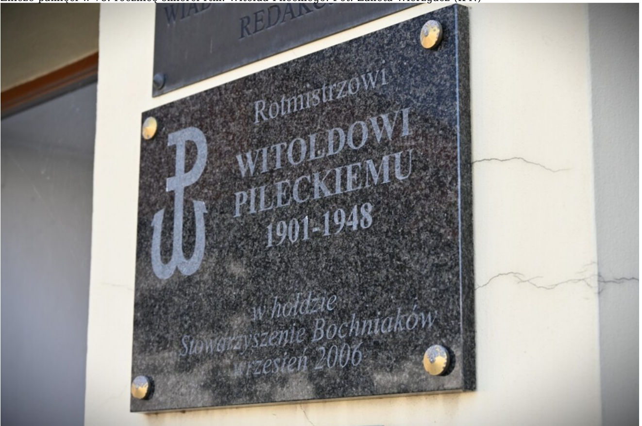
Znicze pamięci w 78. rocznicę śmierci rtm. Witolda Pileckiego.