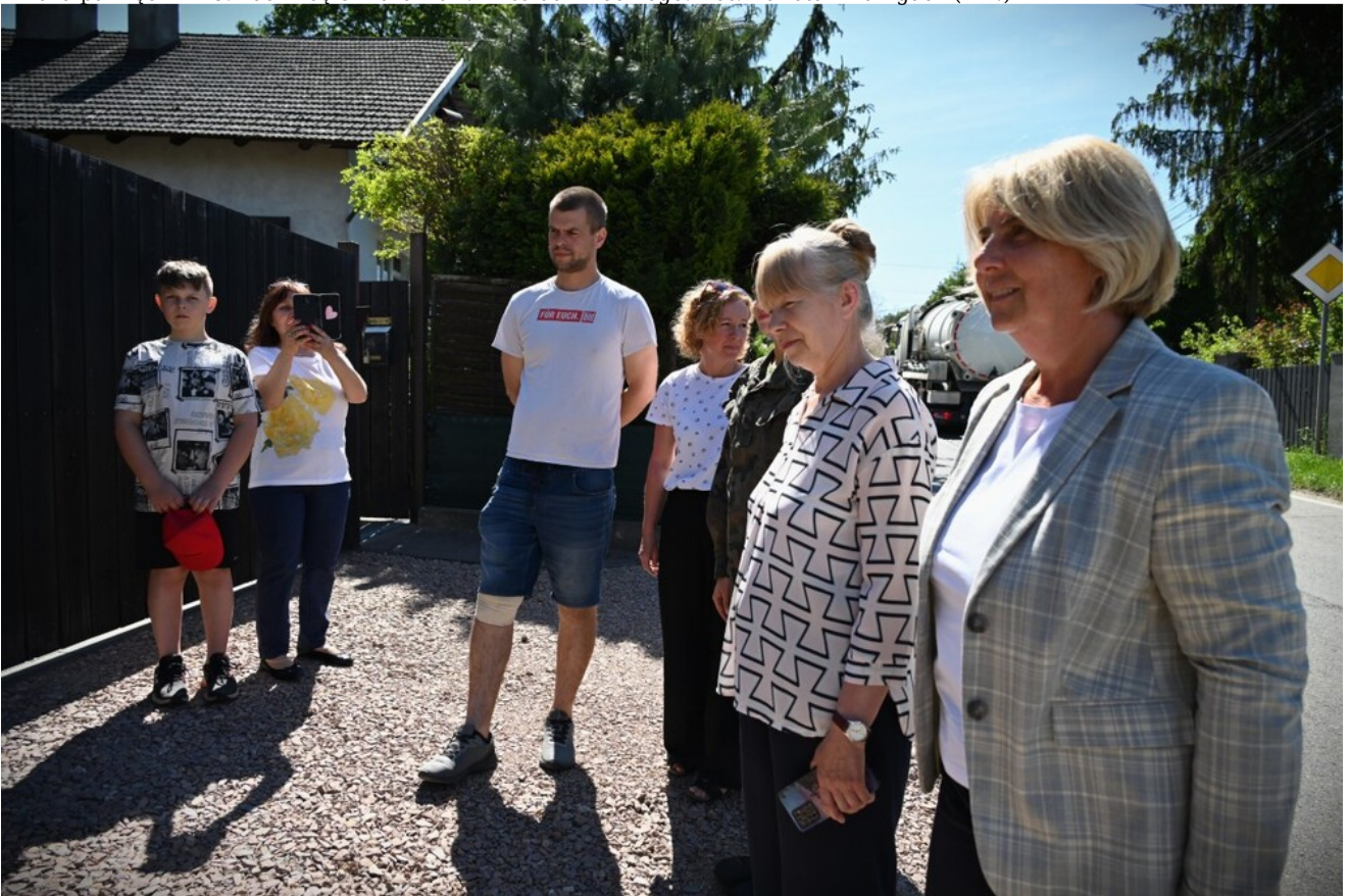
Znicze pamięci w 78. rocznicę śmierci rtm. Witolda Pileckiego.