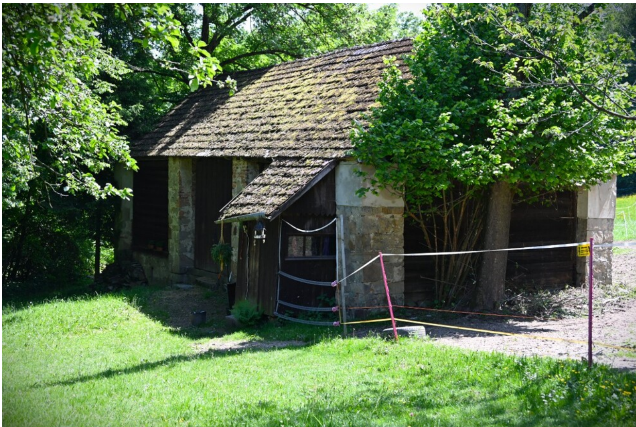
Znicze pamięci w 78. rocznicę śmierci rtm. Witolda Pileckiego.