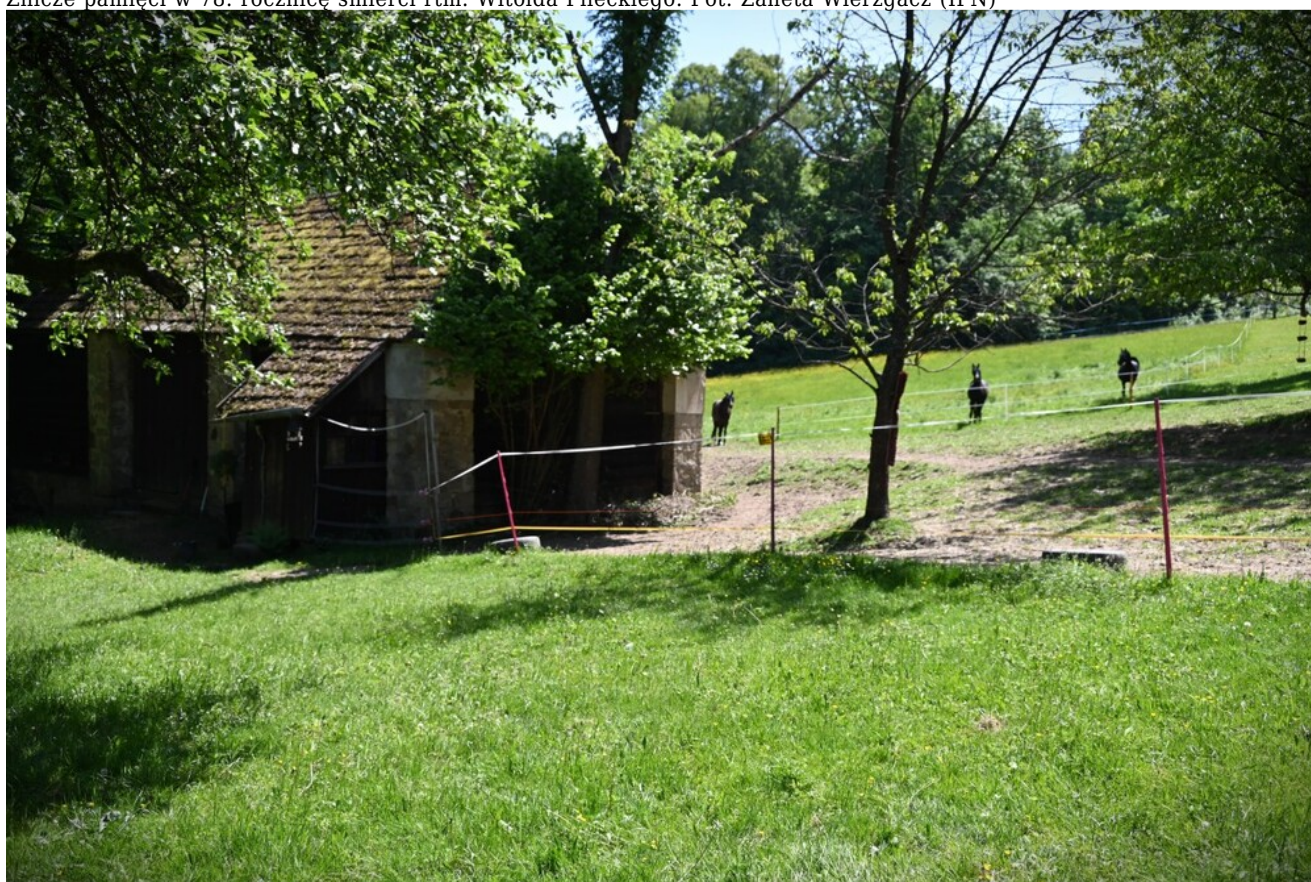
Znicze pamięci w 78. rocznicę śmierci rtm. Witolda Pileckiego.