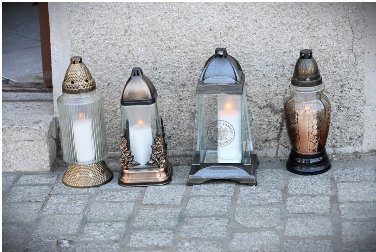
Znicze pamięci w 78. rocznicę śmierci rtm. Witolda Pileckiego.