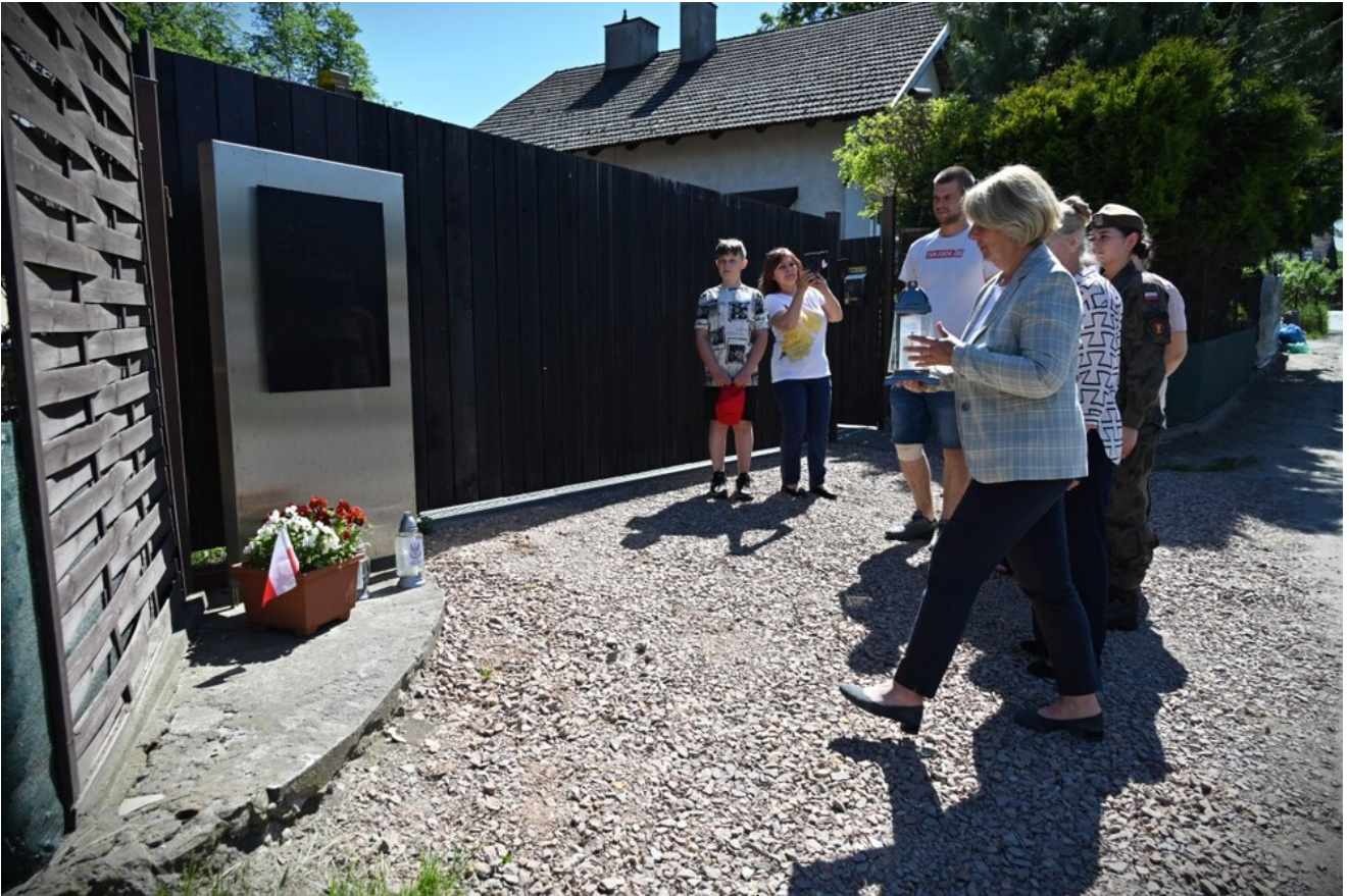
Znicze pamięci w 78. rocznicę śmierci rtm. Witolda Pileckiego.