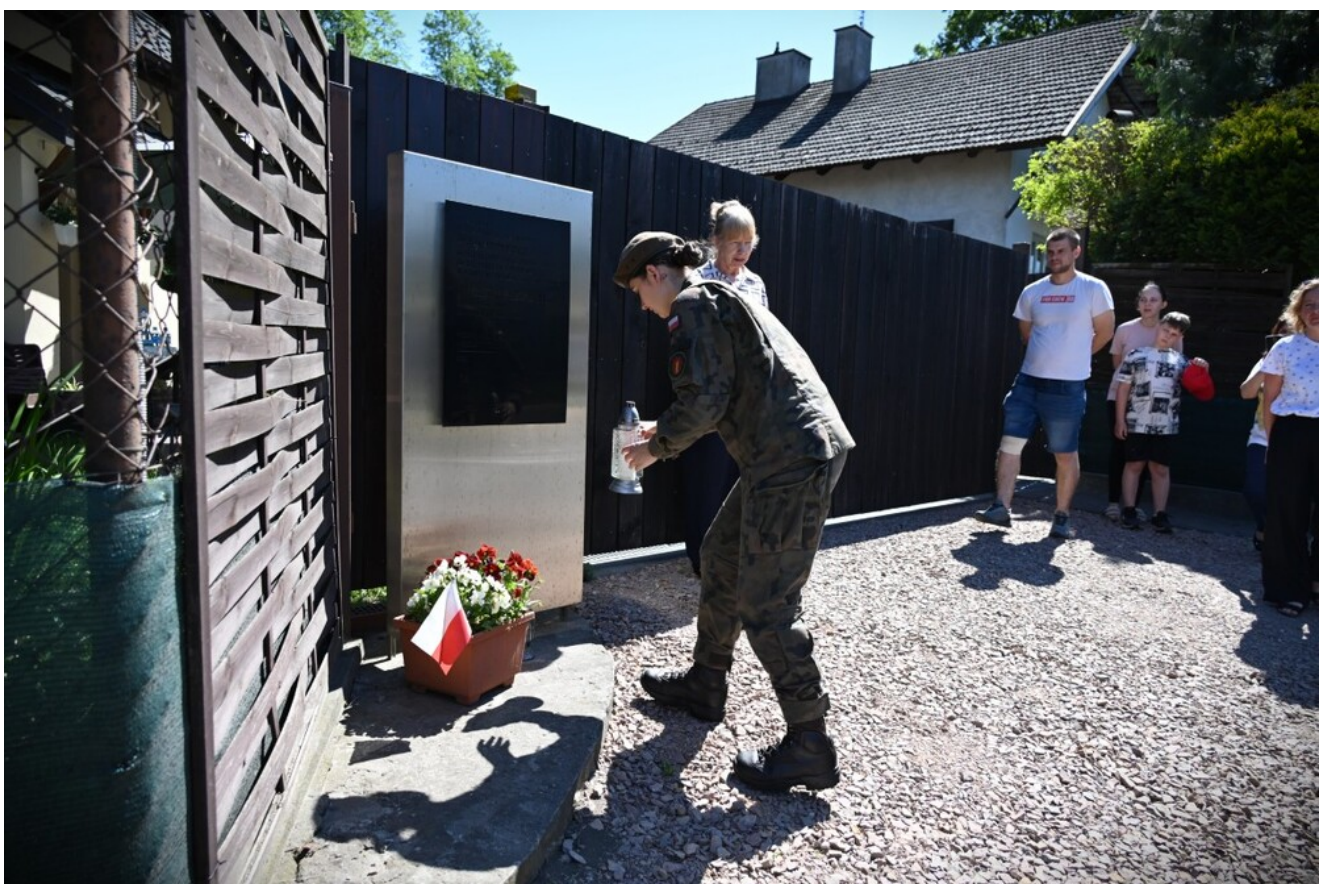
Znicze pamięci w 78. rocznicę śmierci rtm. Witolda Pileckiego.

Następnie dyrektor Radoń złożyła znicz pod tablicą przy dworku Koryznówka w Nowym Wiśniczu (obecnie remontowanym Muzeum Pamiątek po Janie Matejce), gdzie nadal można zobaczyć stodołę, w której Witold Pilecki sypiał, ukrywając się na terenie dworku przez kilka tygodni.