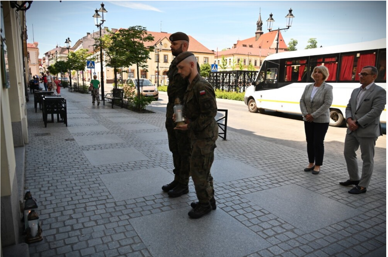
Znicze pamięci w 78. rocznicę śmierci rtm. Witolda Pileckiego.