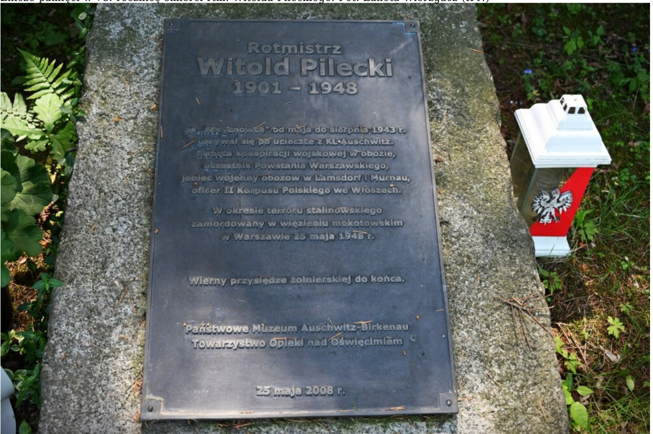
Znicze pamięci w 78. rocznicę śmierci rtm. Witolda Pileckiego.