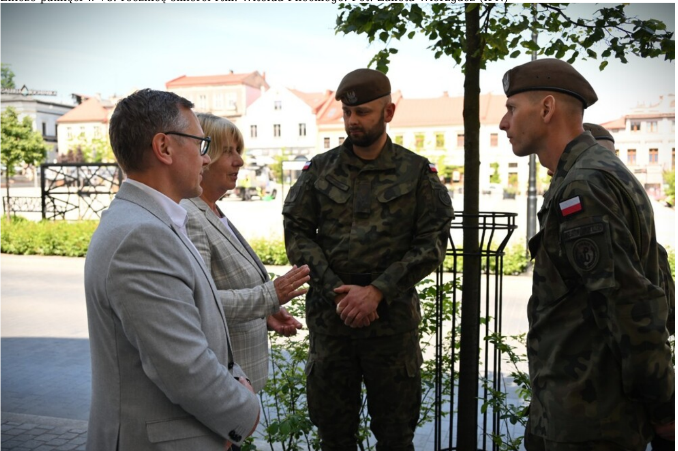
Znicze pamięci w 78. rocznicę śmierci rtm. Witolda Pileckiego.