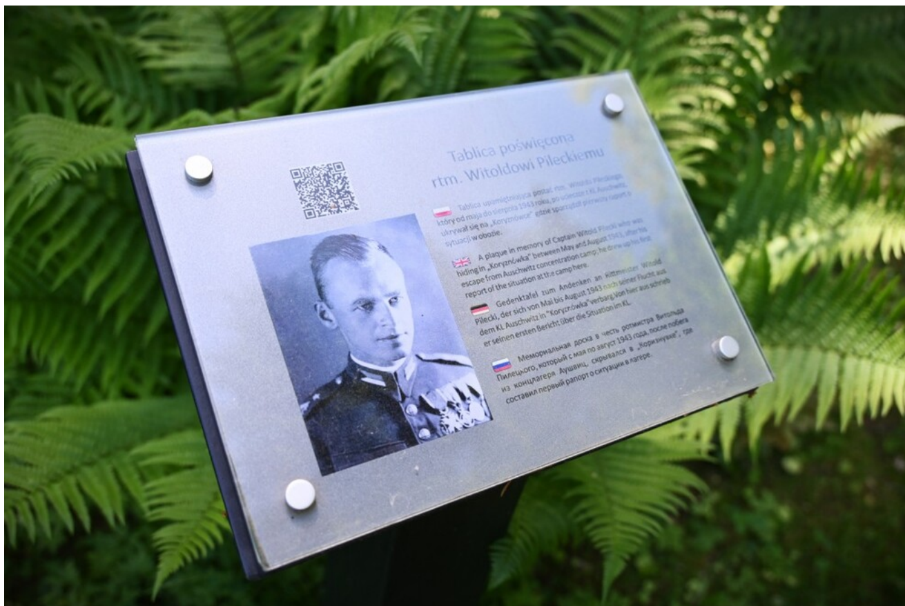
Znicze pamięci w 78. rocznicę śmierci rtm. Witolda Pileckiego.