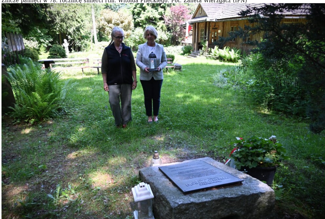
Znicze pamięci w 78. rocznicę śmierci rtm. Witolda Pileckiego.