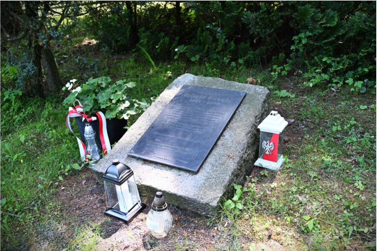
Znicze pamięci w 78. rocznicę śmierci rtm. Witolda Pileckiego.