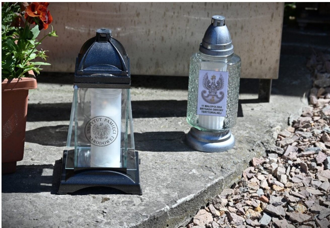
Znicze pamięci w 78. rocznicę śmierci rtm. Witolda Pileckiego.