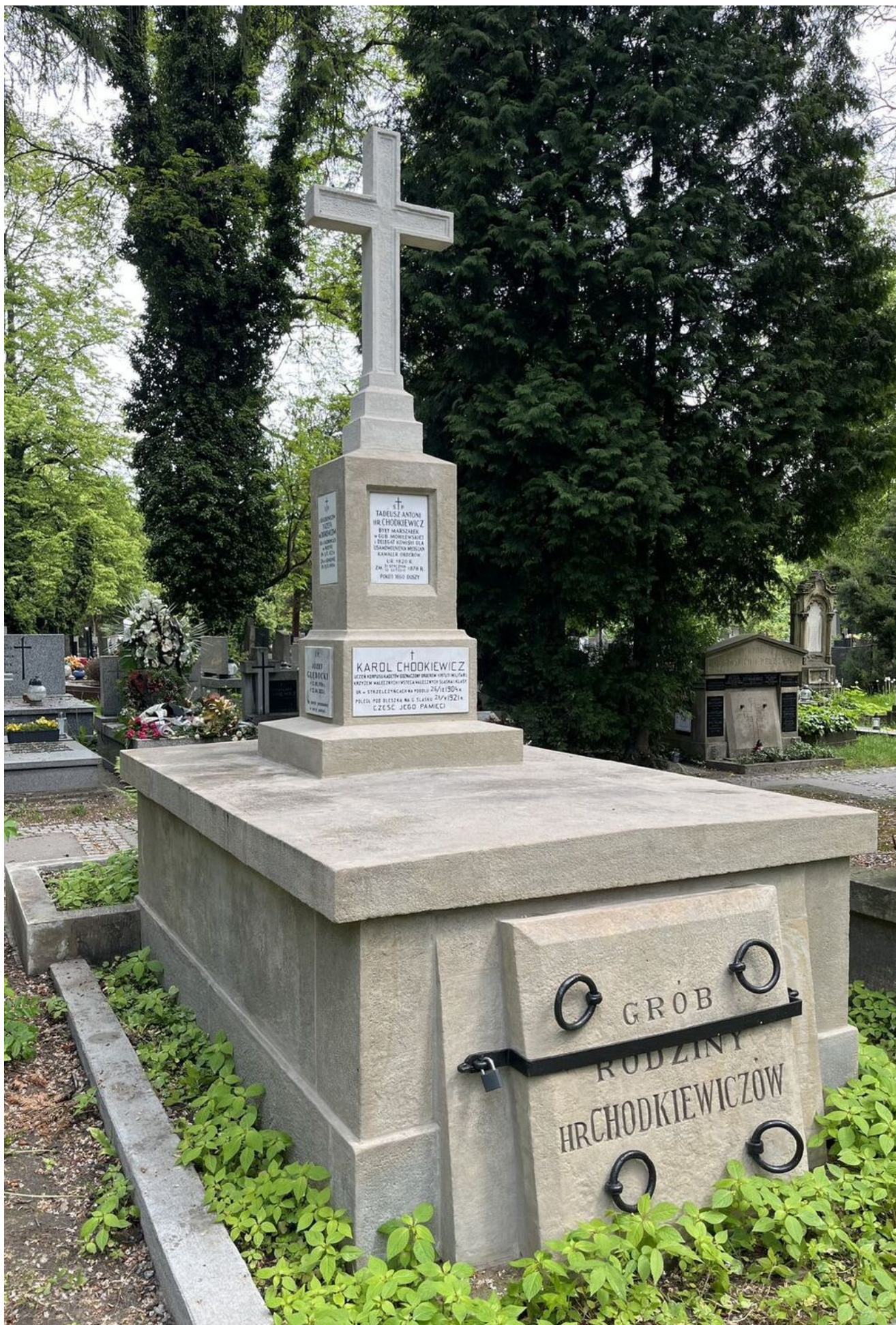
Odnowiony przez IPN grób Karola Chodkiewicza.