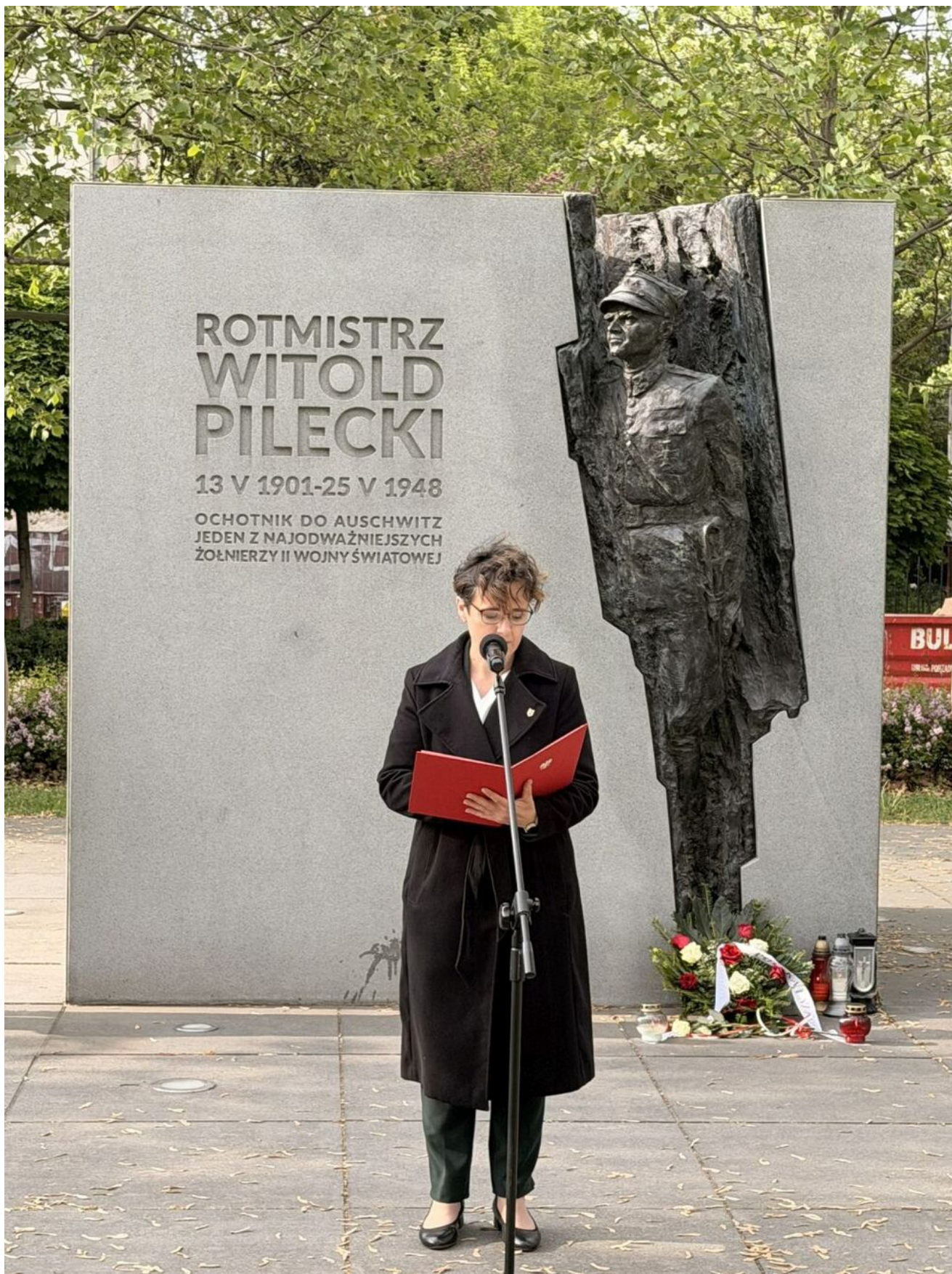
Uroczystości upamiętniające 125. rocznicę urodzin Witolda Pileckiego - Warszawa, 13 maja 2026.