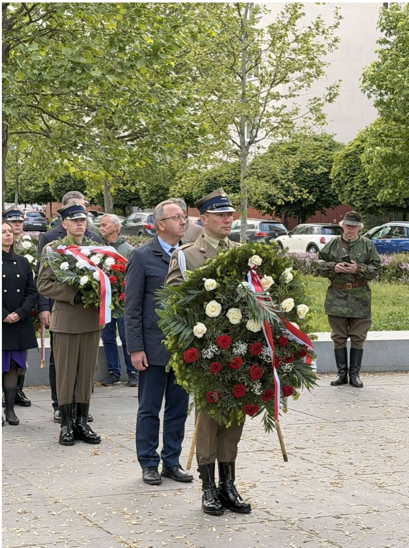
Uroczystości upamiętniające 125. rocznicę urodzin Witolda Pileckiego - Warszawa, 13 maja 2026.