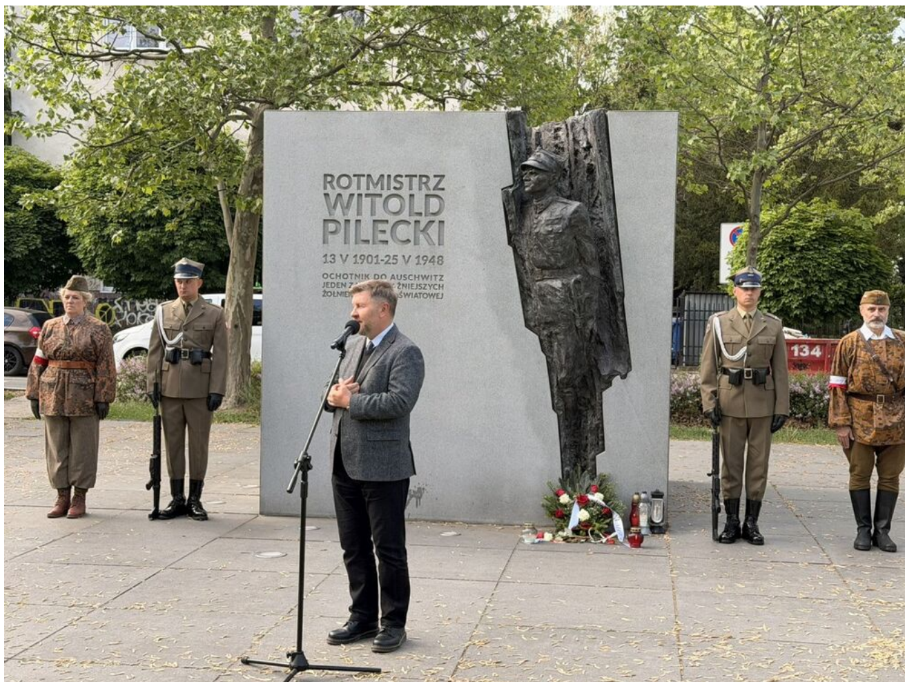
Uroczystości upamiętniające 125. rocznicę urodzin Witolda Pileckiego - Warszawa, 13 maja 2026.