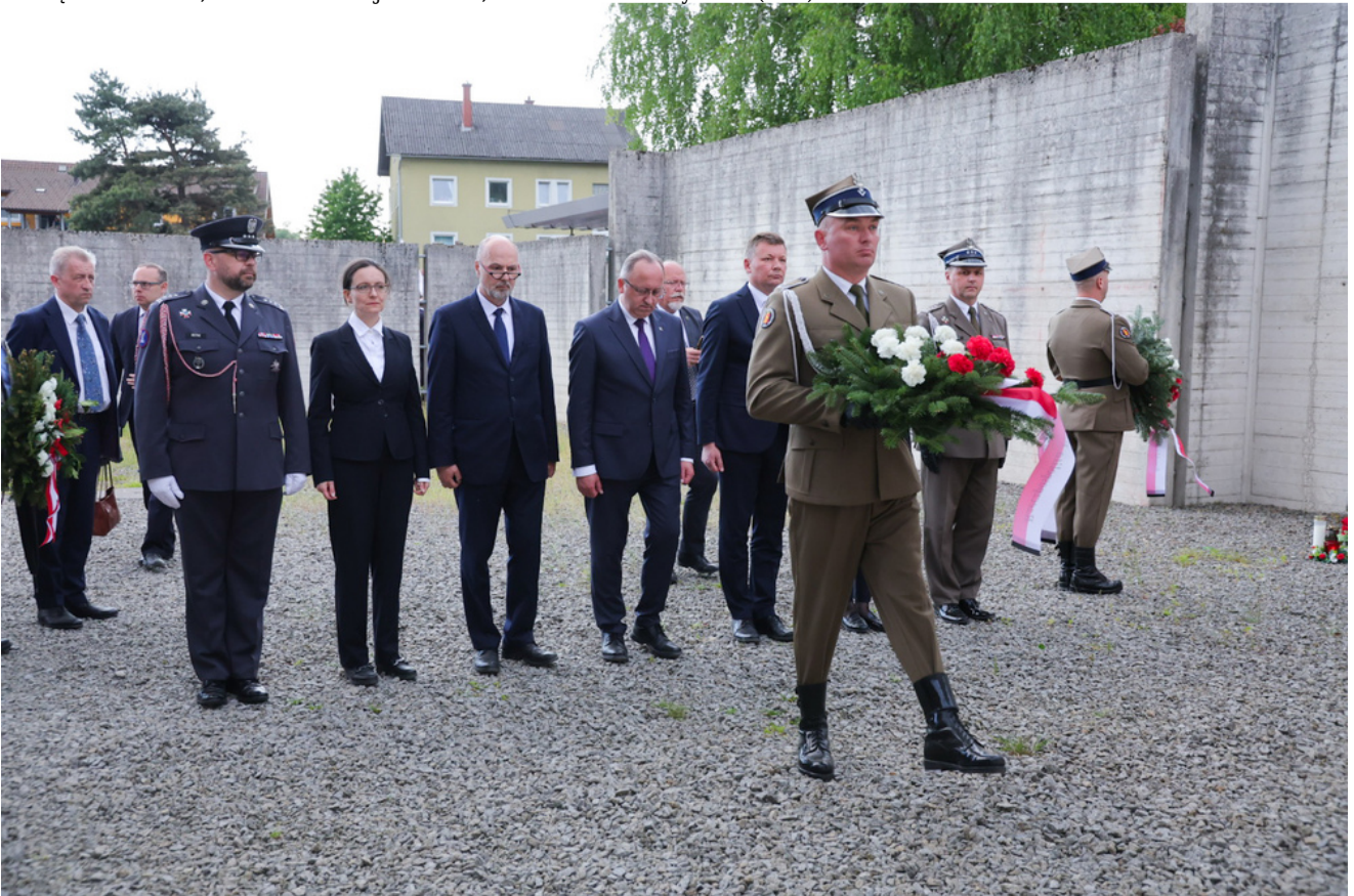
Obchody 81. rocznicy wyzwolenia więźniów obozów koncentracyjnych systemu Mauthausen-Gusen, uroczystości w Miejscu Pamięci KL Gusen, Austria - 9 maja 2026 r.