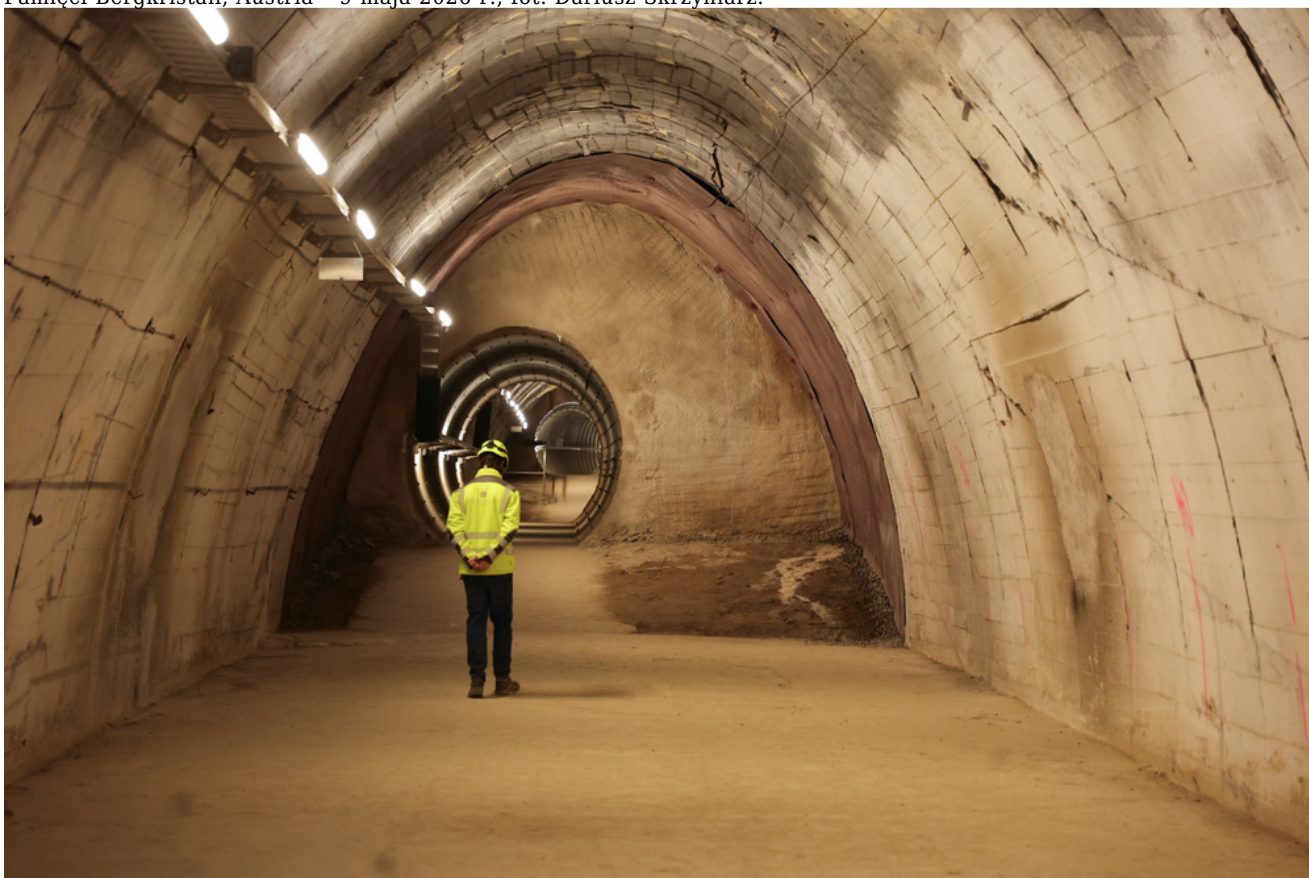
Obchody 81. rocznicy wyzwolenia więźniów obozów koncentracyjnych systemu Mauthausen-Gusen, uroczystości w Miejscu Pamięci Bergkristall, Austria - 9 maja 2026 r., fot. Dariusz Skrzyński.

Dzisiejszą część obchodów 81. rocznicy wyzwolenia więźniów obozów koncentracyjnych systemu Mauthausen-Gusen zwieńczyły uroczystości w Miejscu Pamięci KL Gusen. W wydarzeniu brał udział Andreas Babler, austriacki wicekanclerz.