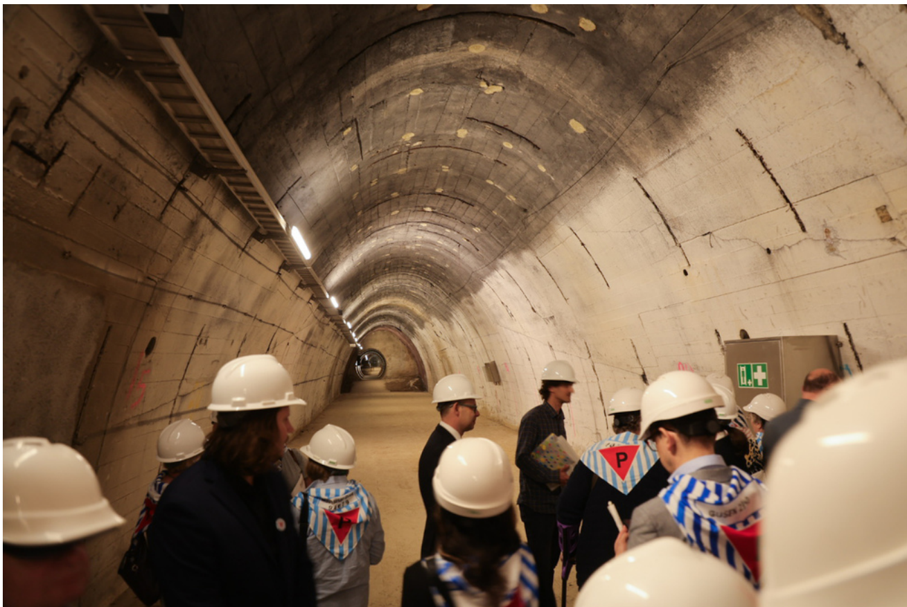
Obchody 81. rocznicy wyzwolenia więźniów obozów koncentracyjnych systemu Mauthausen-Gusen, uroczystości w Miejscu Pamięci Bergkristall, Austria - 9 maja 2026 r., fot. Dariusz Skrzyński.