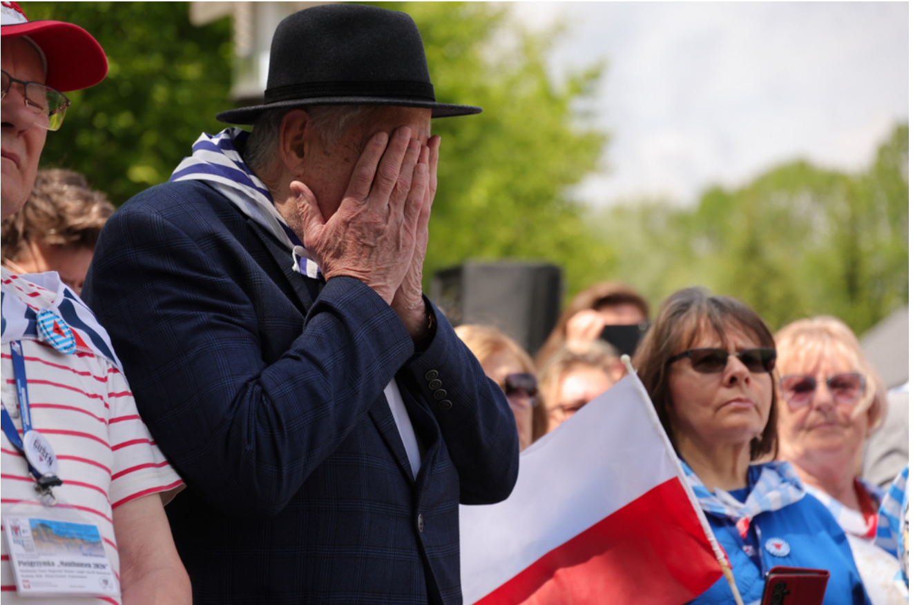
Obchody 81. rocznicy wyzwolenia więźniów obozów koncentracyjnych systemu Mauthausen-Gusen, uroczystości w Miejscu Pamięci Bergkristall, Austria - 9 maja 2026 r., fot. Dariusz Skrzyniarz.