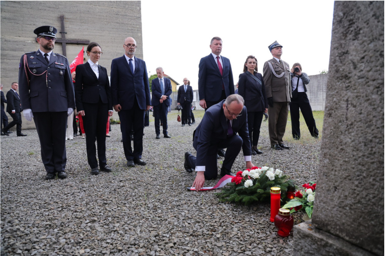
Obchody 81. rocznicy wyzwolenia więźniów obozów koncentracyjnych systemu Mauthausen-Gusen, uroczystości w Miejscu Pamięci KL Gusen, Austria - 9 maja 2026 r.