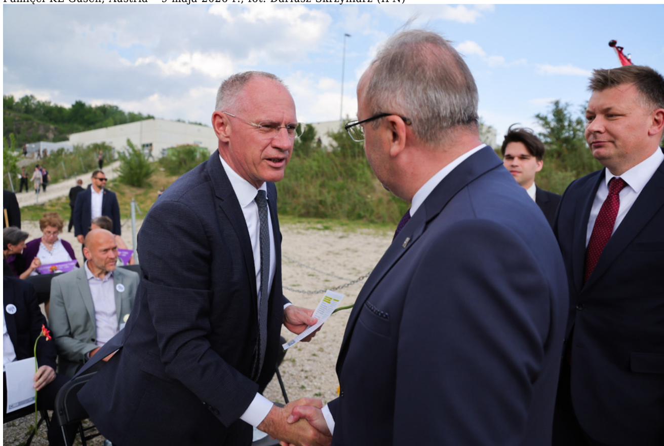
Obchody 81. rocznicy wyzwolenia więźniów obozów koncentracyjnych systemu Mauthausen-Gusen, uroczystości w Miejscu Pamięci KL Gusen, Austria - 9 maja 2026 r.