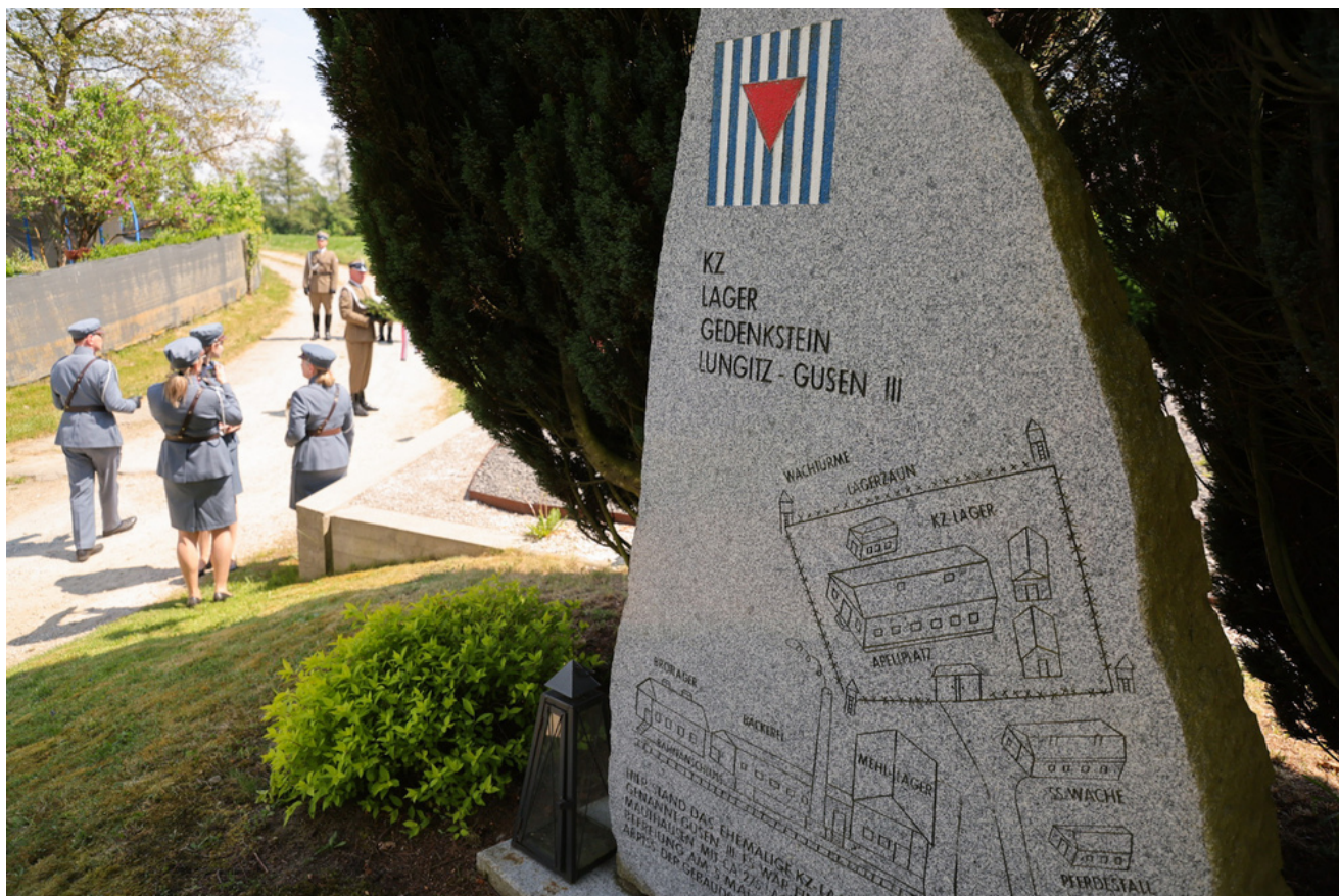
Obchody 81. rocznicy wyzwolenia więźniów obozów koncentracyjnych systemu Mauthausen-Gusen, uroczystości pod Lungitz - Camp Gusen III Memorial, Austria - 9 maja 2026 r.