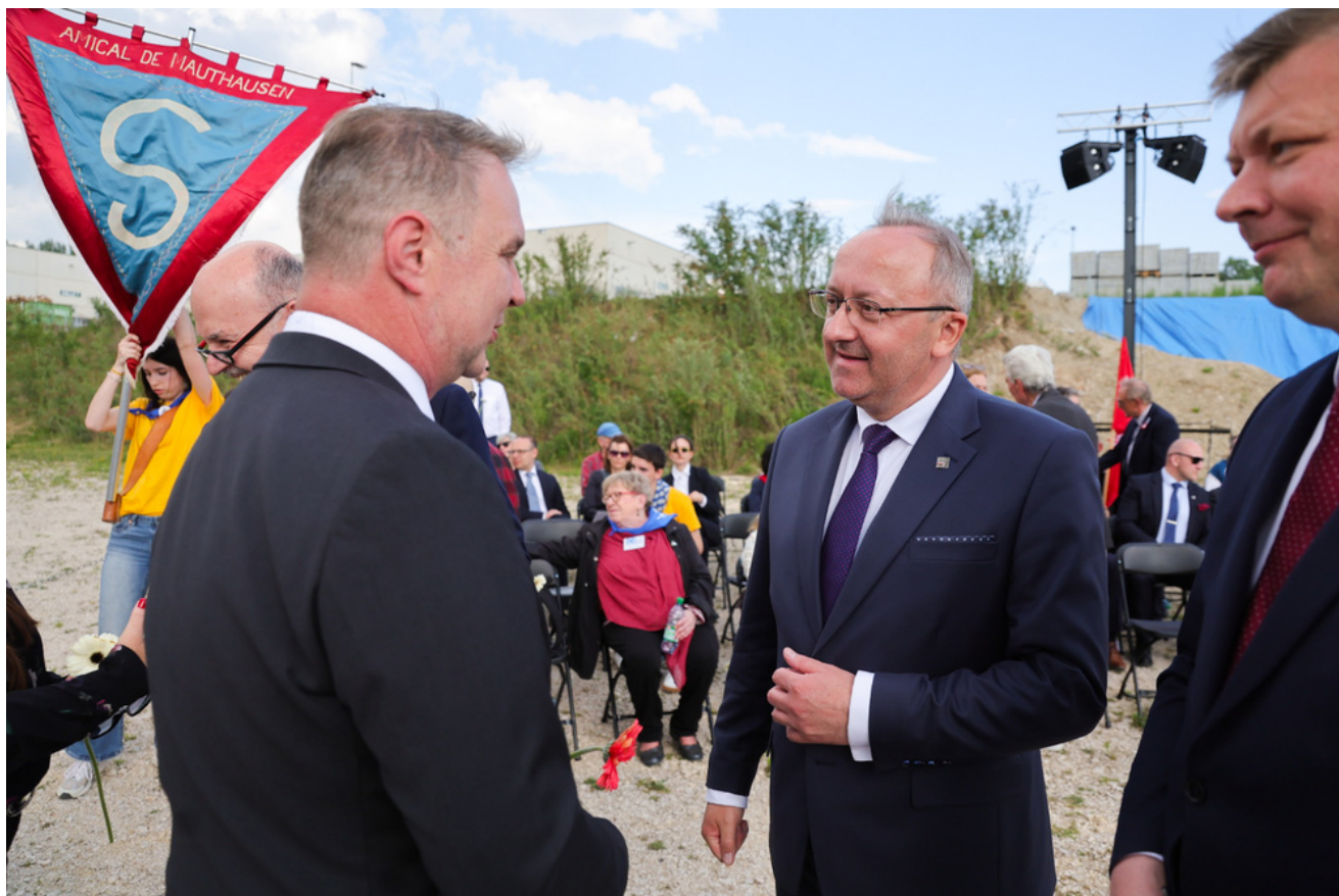
Obchody 81. rocznicy wyzwolenia więźniów obozów koncentracyjnych systemu Mauthausen-Gusen, uroczystości w Miejscu Pamięci KL Gusen, Austria - 9 maja 2026 r.