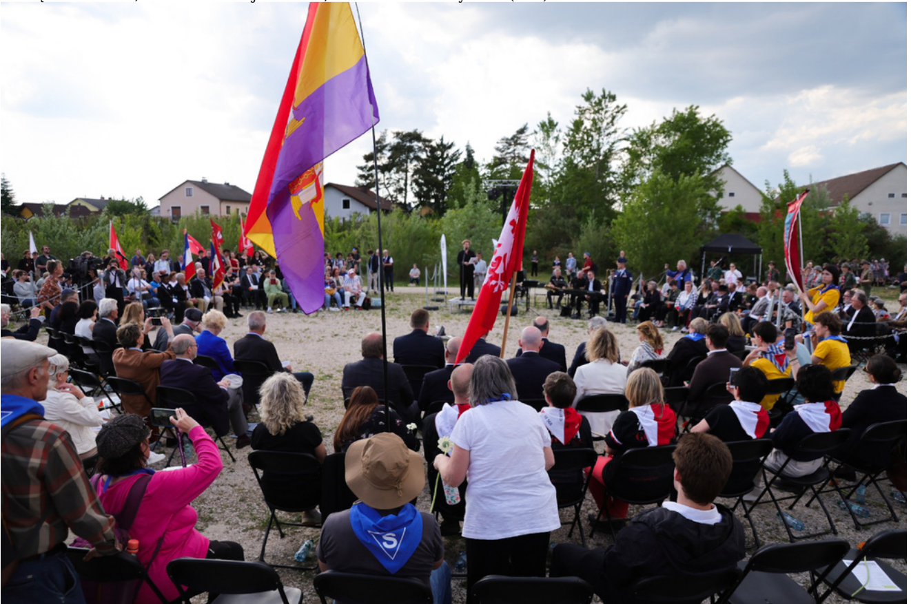
Obchody 81. rocznicy wyzwolenia więźniów obozów koncentracyjnych systemu Mauthausen-Gusen, uroczystości w Miejscu Pamięci KL Gusen, Austria - 9 maja 2026 r.