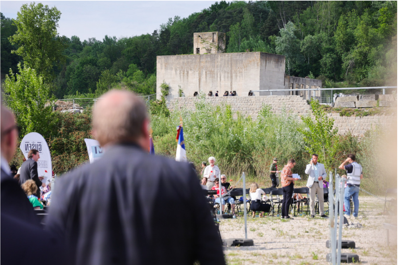
Obchody 81. rocznicy wyzwolenia więźniów obozów koncentracyjnych systemu Mauthausen-Gusen, uroczystości w Miejscu Pamięci KL Gusen, Austria - 9 maja 2026 r., fot. Dariusz Skrzyniarz (IPN)