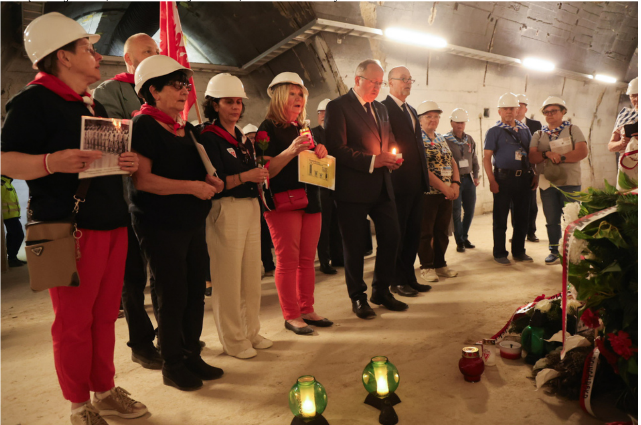
Obchody 81. rocznicy wyzwolenia więźniów obozów koncentracyjnych systemu Mauthausen-Gusen, uroczystości w Miejscu Pamięci Bergkristall, Austria - 9 maja 2026 r.