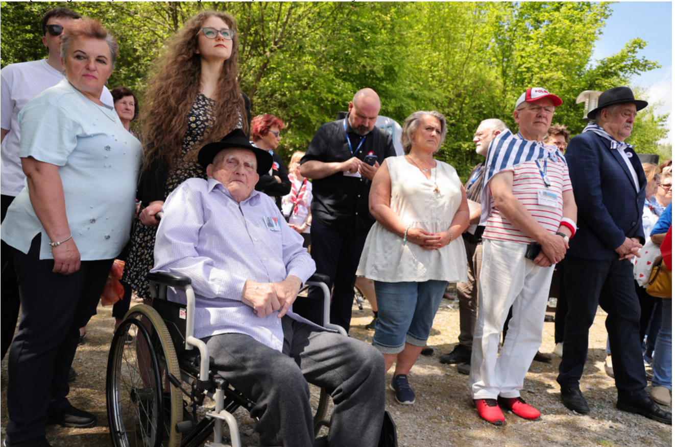
Obchody 81. rocznicy wyzwolenia więźniów obozów koncentracyjnych systemu Mauthausen-Gusen, uroczystości w Miejscu Pamięci Bergkristall, Austria - 9 maja 2026 r., fot. Dariusz Skrzyniarz.