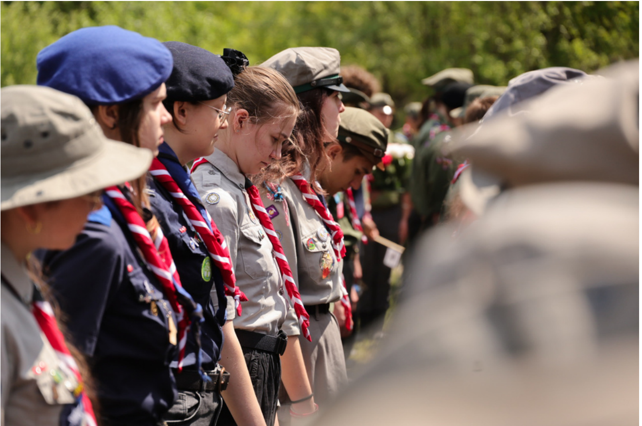
Obchody 81. rocznicy wyzwolenia więźniów obozów koncentracyjnych systemu Mauthausen-Gusen, uroczystości w Miejscu Pamięci Bergkristall, Austria - 9 maja 2026 r., fot. Dariusz Skrzyński.