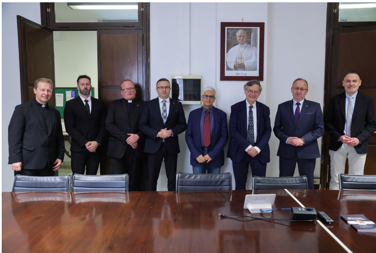
Wizyta w Radiu Watykańskim – 30 kwietnia 2026.