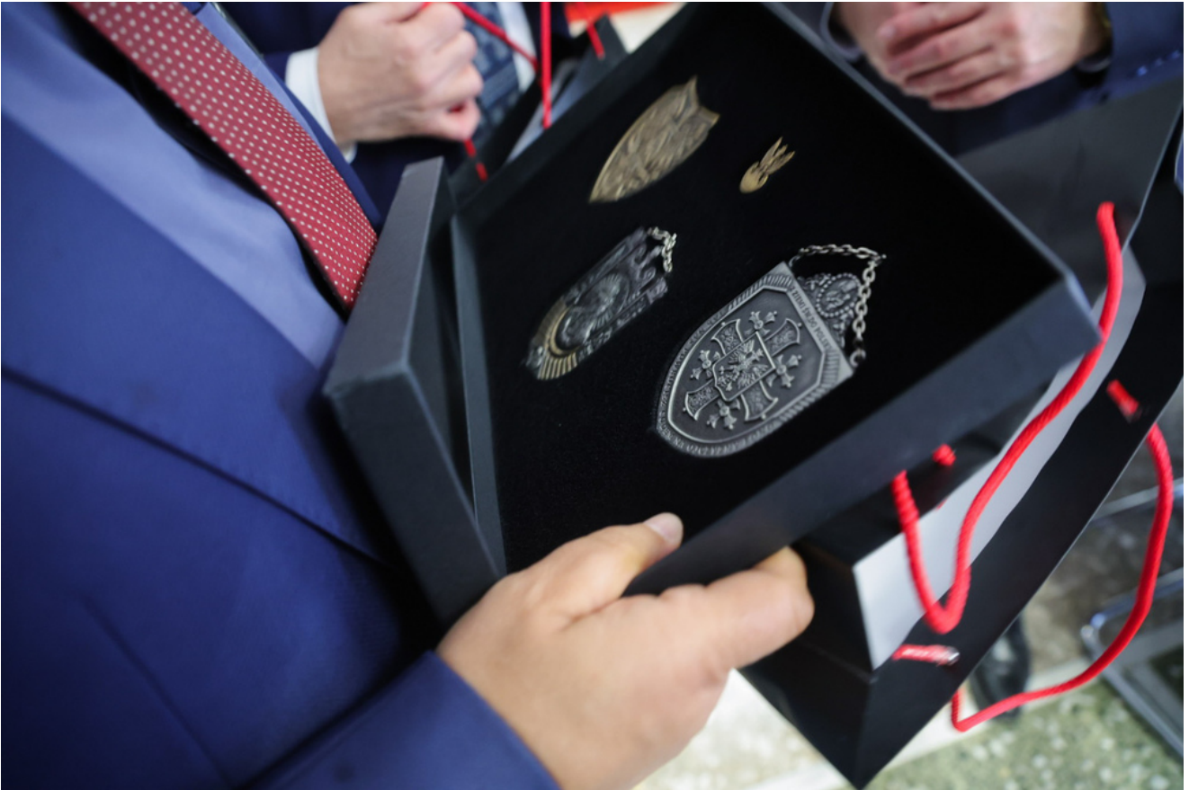
Wizyta w Radiu Watykańskim – 30 kwietnia 2026.