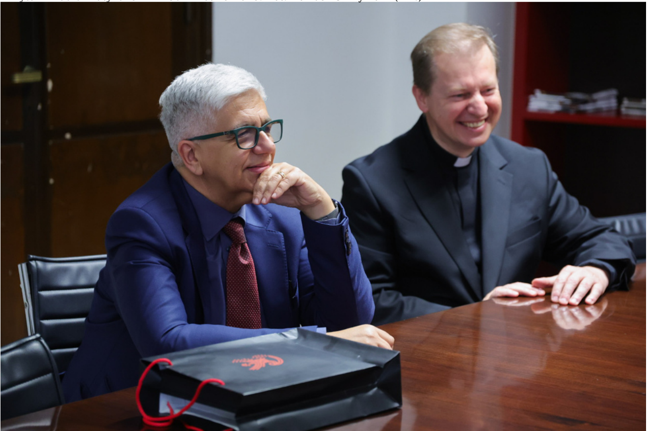
Wizyta w Radiu Watykańskim – 30 kwietnia 2026.