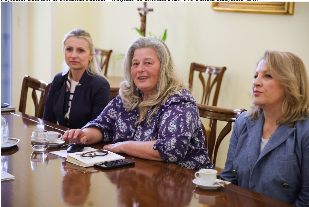
Spotkanie z dyrektorem z Sobotniej Szkoły Kultury i Języka Polskiego w Lago Patria i prezesem Stowarzyszenia „Instytut dla Polonii” - Watykan, 30 kwietnia 2026.