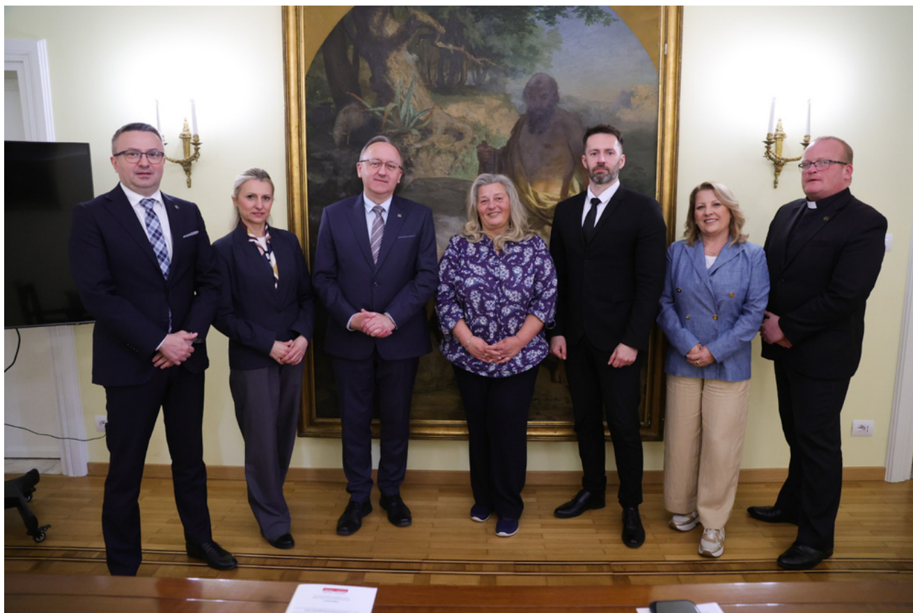
Spotkanie z dyrektorem z Sobotniej Szkoły Kultury i Języka Polskiego w Lago Patria i prezes Stowarzyszenia „Instytut dla Polonii” - Watykan, 30 kwietnia 2026.