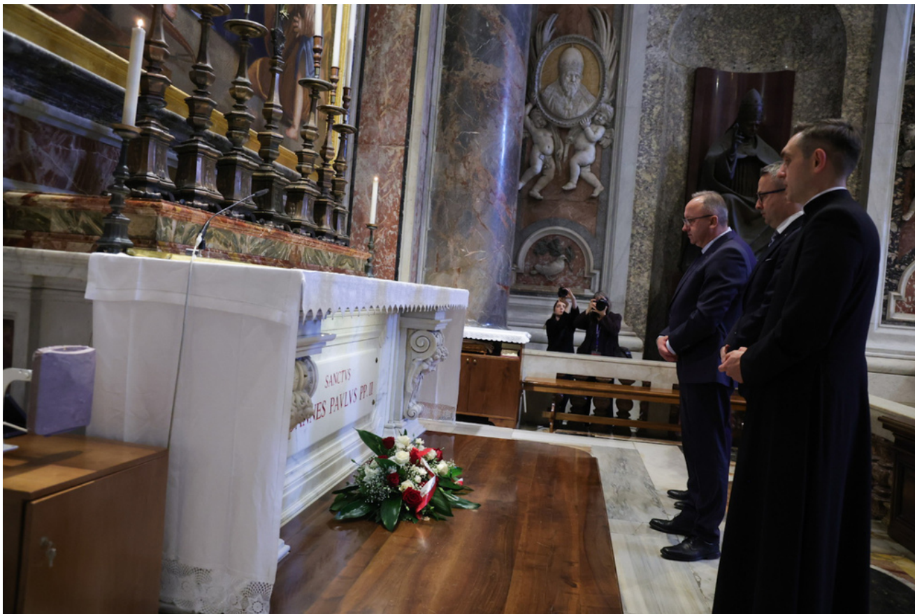
Msza św. w Bazylice św. Piotra w Watykanie - 30 kwietnia 2026.