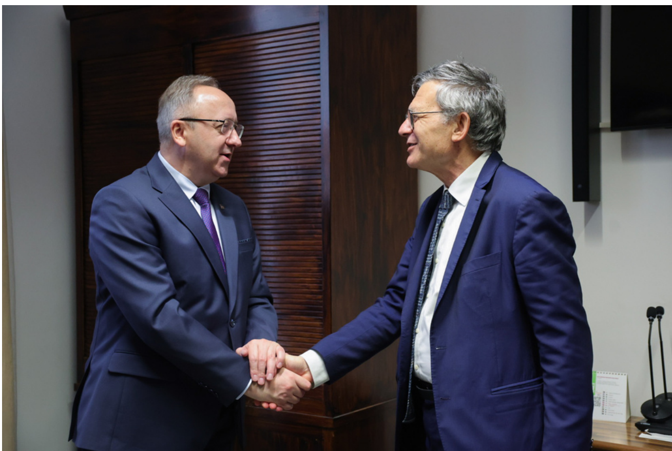
Wizyta w Radiu Watykańskim - 30 kwietnia 2026.