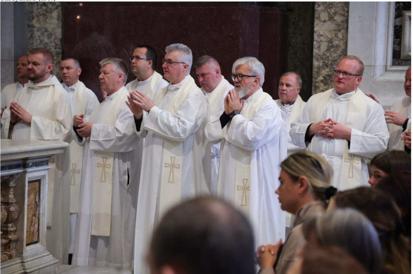
Msza św. w Bazylice św. Piotra w Watykanie - 30 kwietnia 2026.