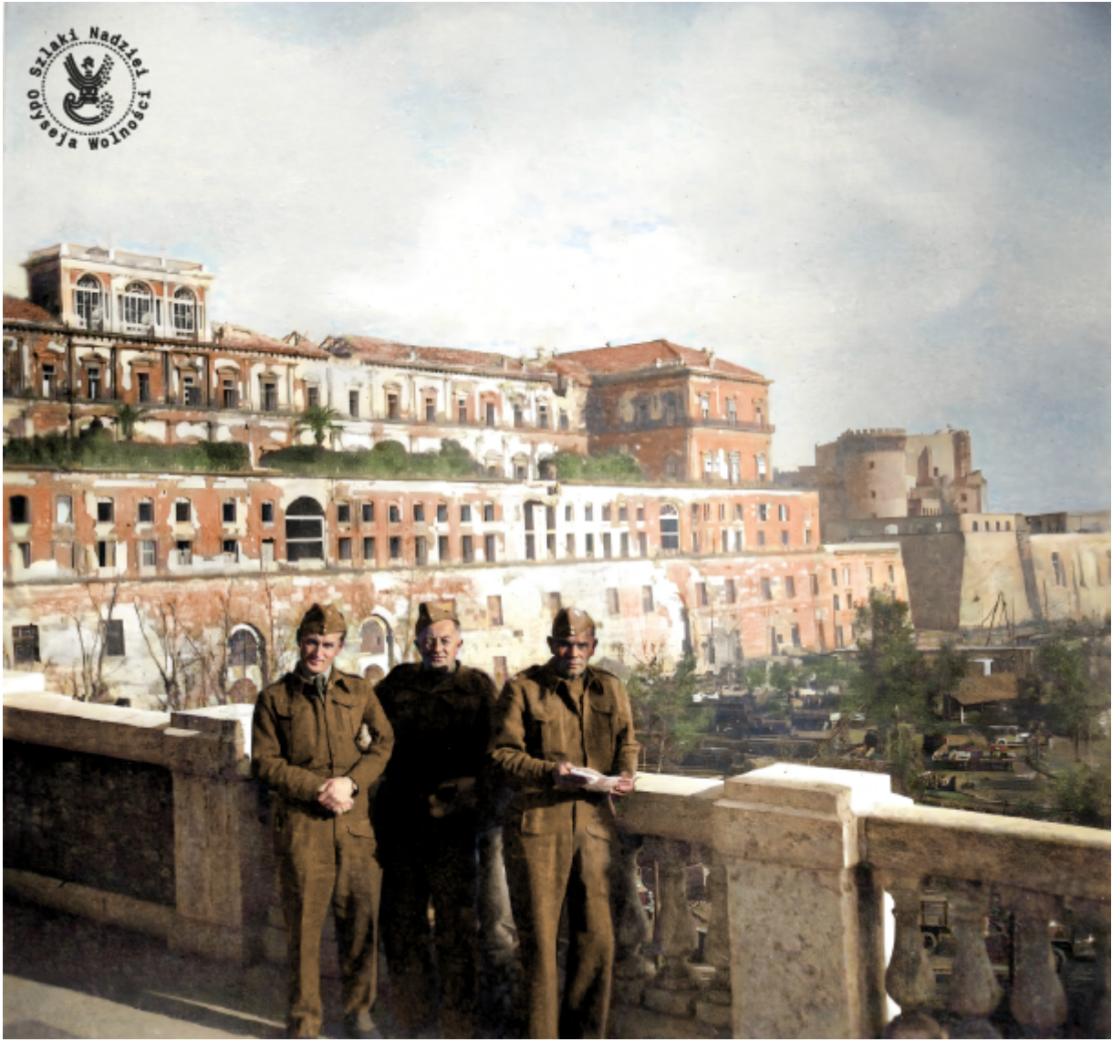
Żołnierze 3. Dywizji Strzelców Karpackich na tle Pałacu Królewskiego w Neapolu w 1944 r.