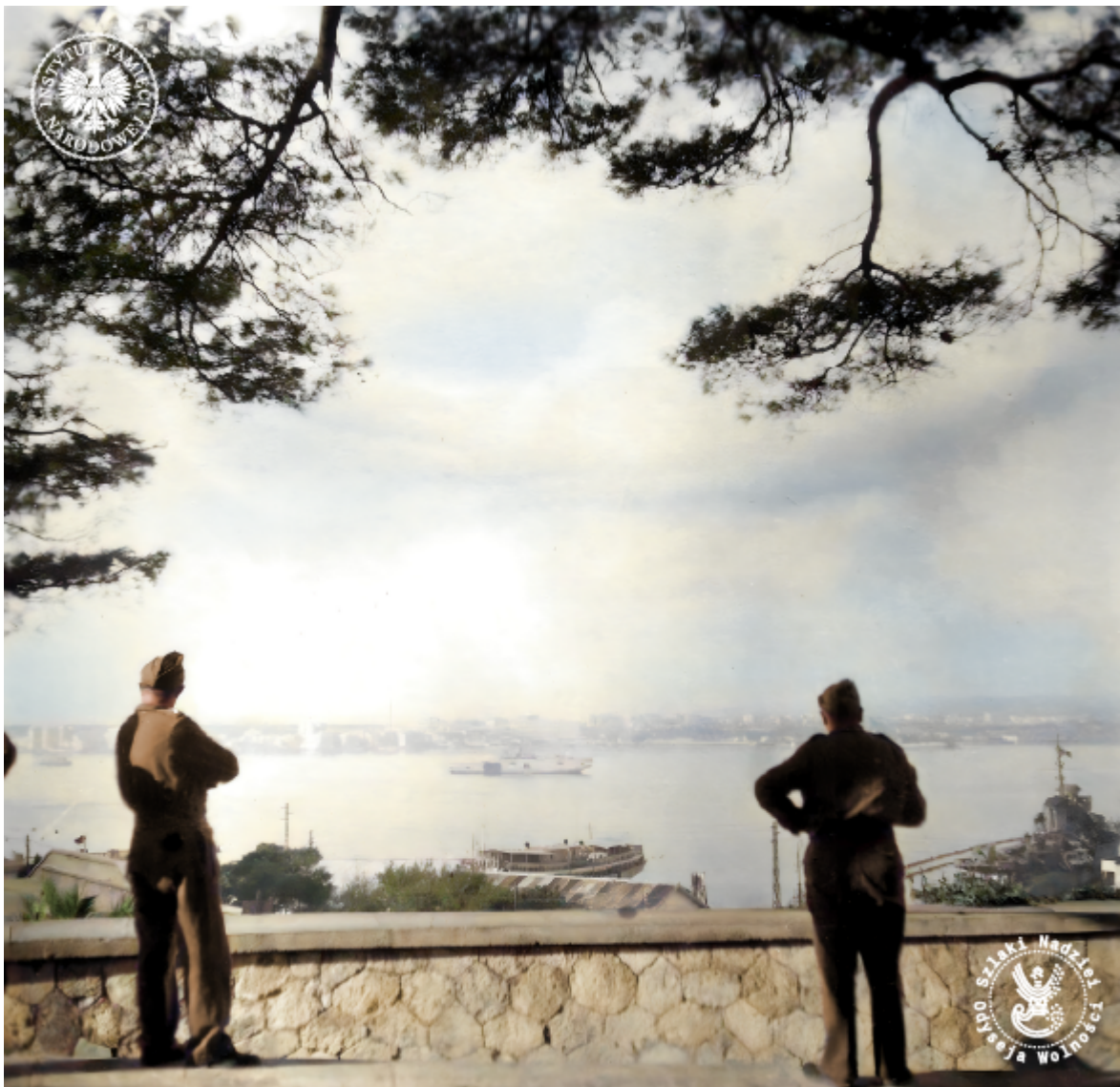
Żołnierze 3. Dywizji Strzelców Karpackich w Tarencie w 1944 r., fot. AIPN