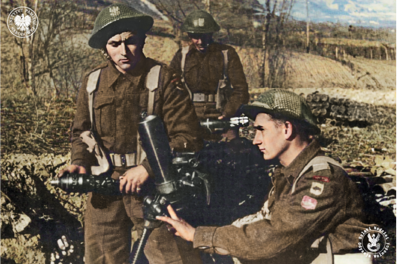
Żołnierze 6. Lwowskiej Brygady Piechoty z 5. Kresowej Dywizji Piechoty przy obsłudze moździerza, 2. Korpus Polski we Włoszech, 1944-1945 r.