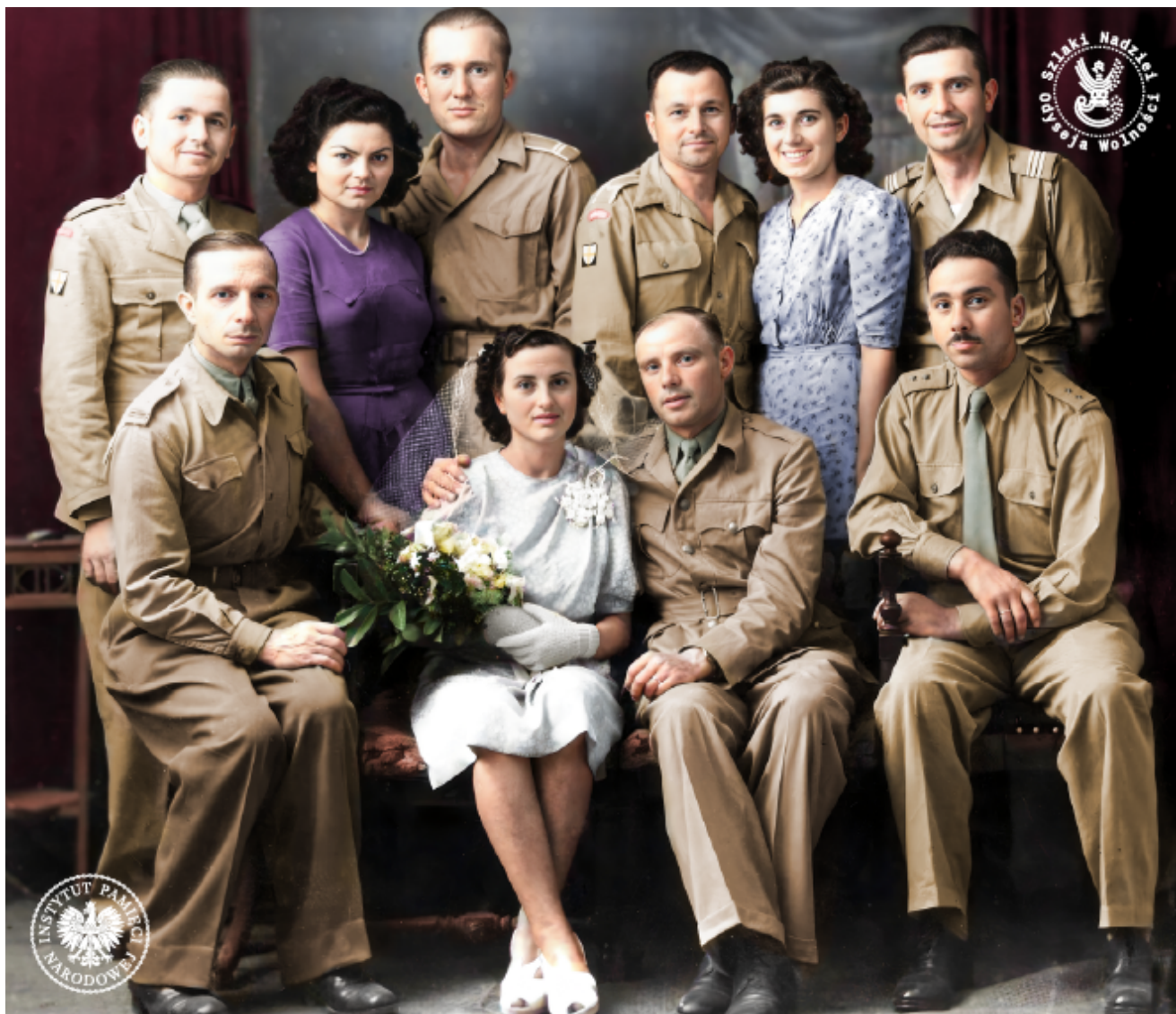
Ślub jednego z żołnierzy 2. Korpusu Polskiego we Włoszech, Mediolan, lata 1944-1946