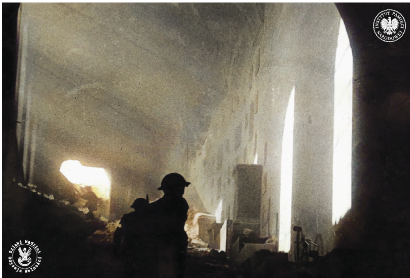
Zołnierze 12. Pułku Ułanów Podolskich należącego do 3. Dywizji Strzelców Karpackich pod dowództwem ppor. Kazimierza Gurbieła wkraczający do ruin klasztoru, 18 V 1944 r.

Powracających do kraju, rządzonego przez komunistów, czekały represje i inwigilacja. Nie traktowano ich jak bohaterów, a jako wrogów nowego komunistycznego systemu.