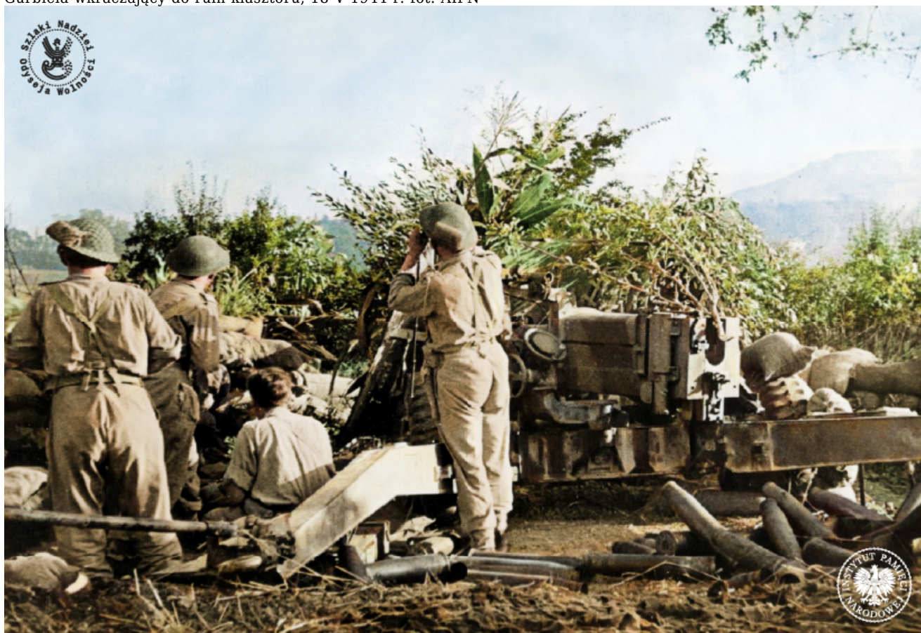
Walki 2. Korpusu Polskiego o Ankonę i przełamanie linii Gotów, lipiec 1944 r.