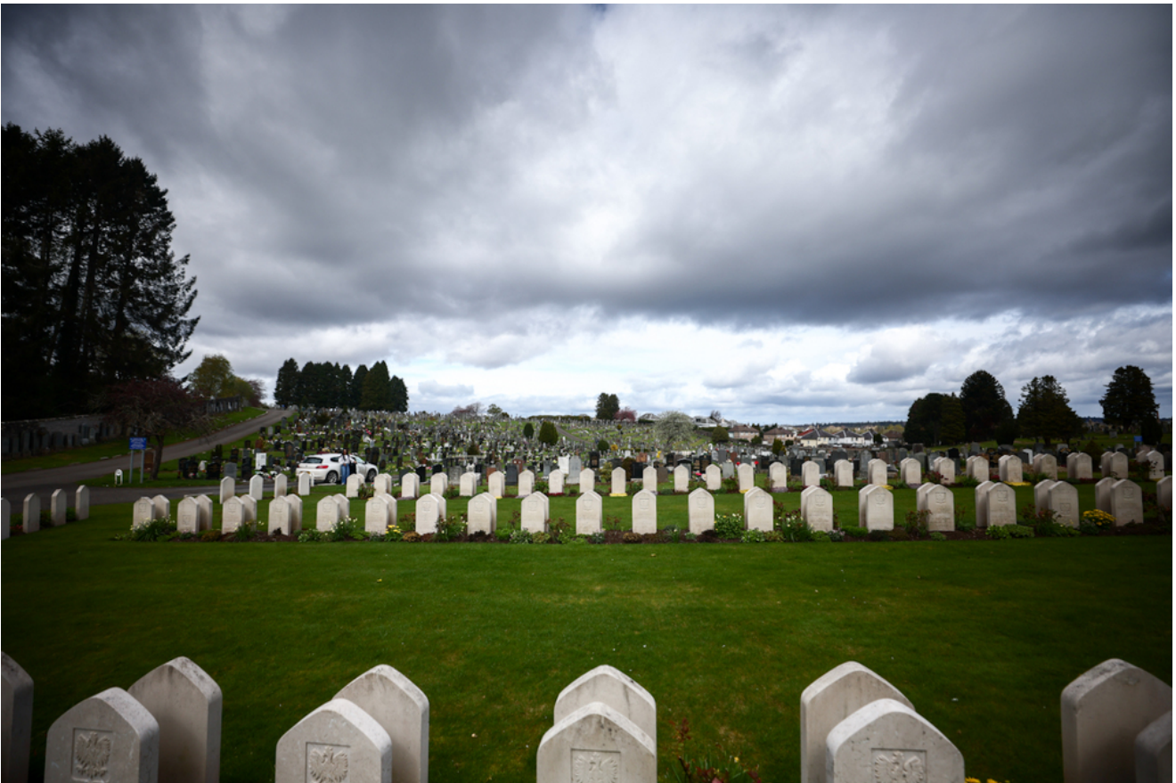
Polish War Graves na Jeanfield and Wellshill Cemetery, Perth - Szkocja, 18 kwietnia 2026 r.