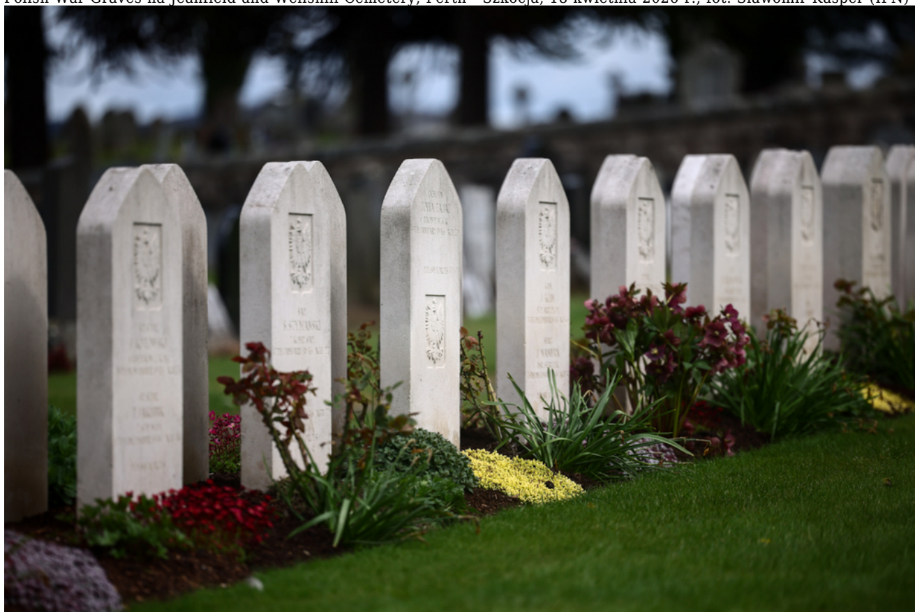
Polish War Graves na Jeanfield and Wellshill Cemetery, Perth - Szkocja, 18 kwietnia 2026 r., fot. Sławomir Kasper (IPN)