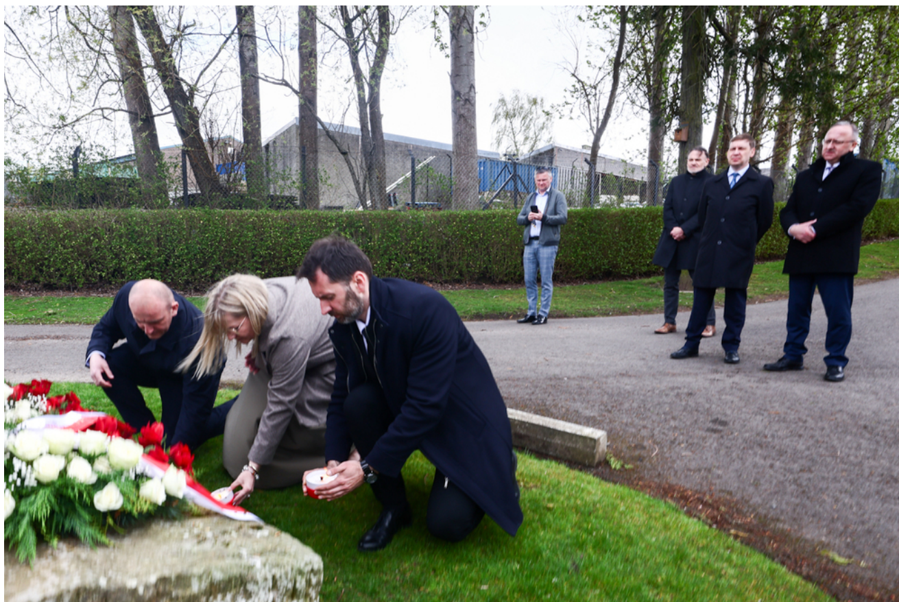
Polish War Graves na Jeanfield and Wellshill Cemetery, Perth - Szkocja, 18 kwietnia 2026 r., fot. Sławomir Kasper (IPN)