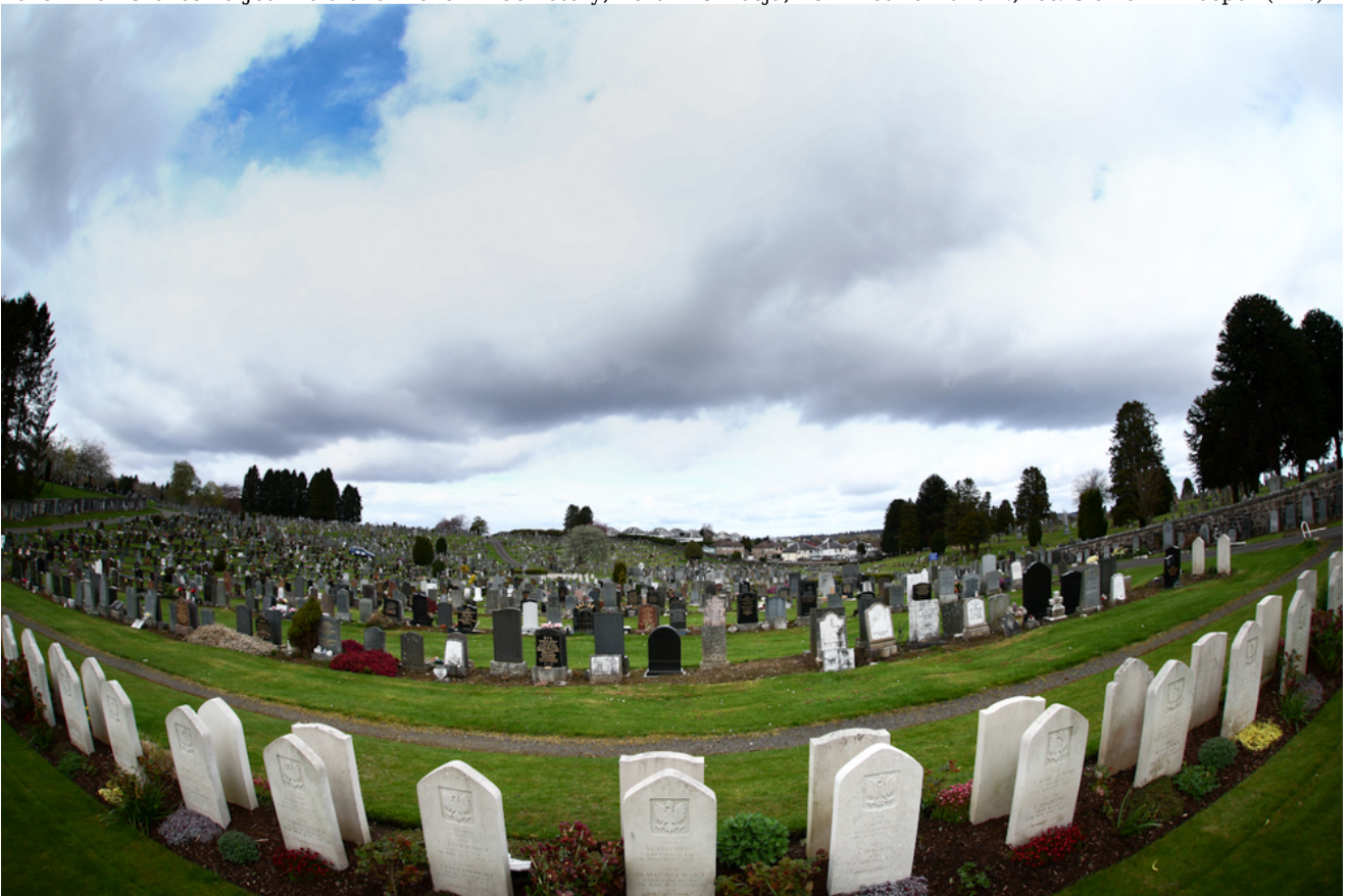
Polish War Graves na Jeanfield and Wellshill Cemetery, Perth - Szkocja, 18 kwietnia 2026 r., fot. Sławomir Kasper (IPN)