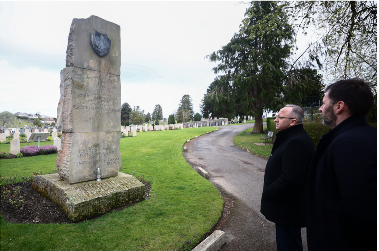
Polish War Graves na Jeanfield and Wellshill Cemetery, Perth - Szkocja, 18 kwietnia 2026 r., fot. Sławomir Kasper (IPN)