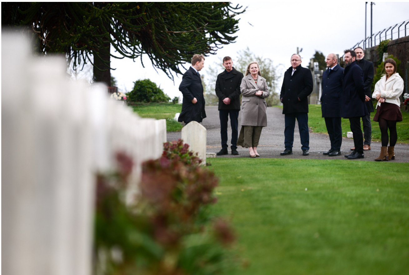
Polish War Graves na Jeanfield and Wellshill Cemetery, Perth - Szkocja, 18 kwietnia 2026 r.