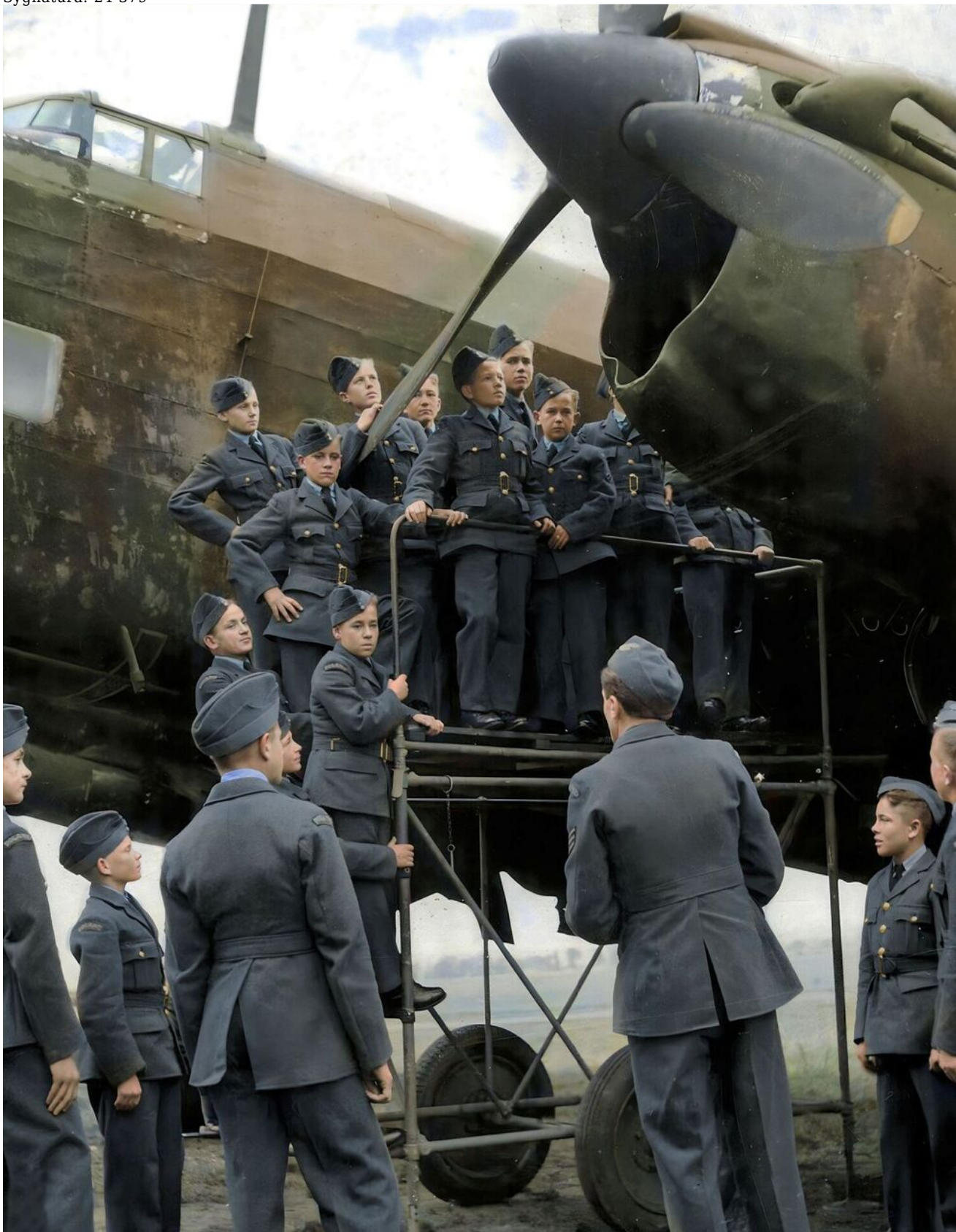
Junacy oglądają brytyjski bombowiec w Wielkiej Brytanii, 1943-1944 IPNBU-2-6-241-9

Dudziarz orkiestry 2 batalionu grenadierów „Kratkowane Lwiątko” 4 Dywizji Piechoty, Szkocja, 1945 r. (fot. NAC) Sygnatura: 24-379