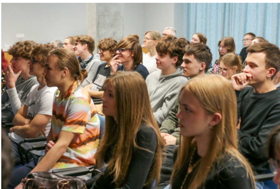
Spotkanie w ramach IX edycji projektu „Łączka i inne miejsca poszukiwań”