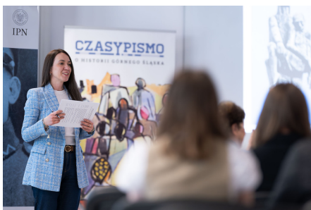
„W kręgu poezji i prozy lagrowej więźniarek KL Ravensbrück im. Wandy Półtawskiej”.

Organizatorami konkursu są: Instytut Pamięci Narodowej, Stowarzyszenie „Rodzina więźniarek niemieckiego obozu koncentracyjnego Ravensbrück” oraz Miasto Ruda Śląska. Konkurs został objęty honorowym patronatem Małżonki Prezydenta RP Marty Nawrockiej. Patronat medialny sprawują: Gość Niedzielny, Radio eM, Radio Katowice oraz TVP3 Katowice.