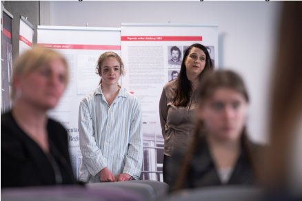
„W kręgu poezji i prozy lagrowej więźniarek KL Ravensbrück im. Wandy Póltawskiej”.