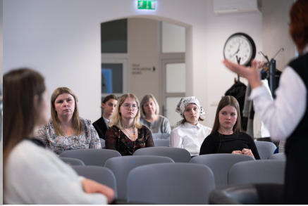
„W kręgu poezji i prozy lagrowej więźniarek KL Ravensbrück im. Wandy Póltawskiej”.