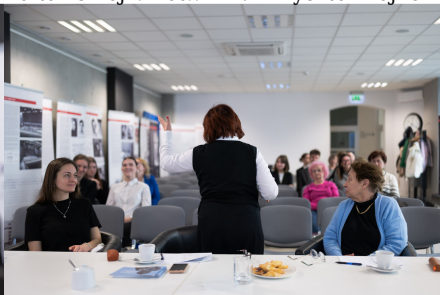
„W kręgu poezji i prozy lagrowej więźniarek KL Ravensbrück im. Wandy Półtawskiej”.