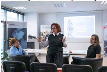
„W kręgu poezji i prozy lagrowej więźniarek KL Ravensbrück im. Wandy Półtawskiej”.