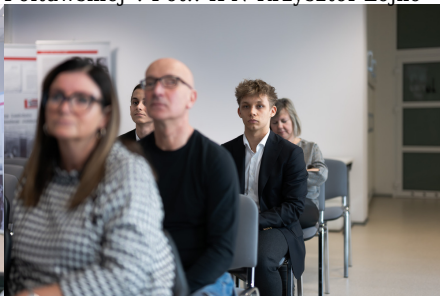
„W kręgu poezji i prozy lagrowej więźniarek KL Ravensbrück im. Wandy Półtawskiej”.