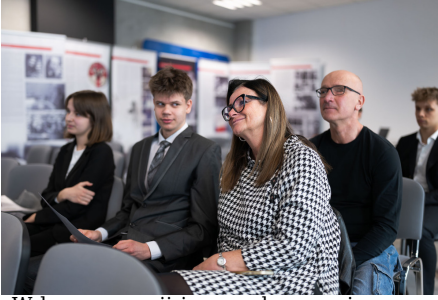
„W kręgu poezji i prozy lagrowej więźniarek KL Ravensbrück im. Wandy Póltawskiej”.