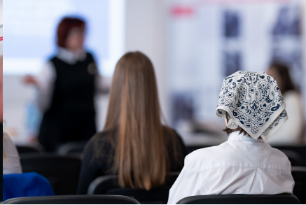
„W kręgu poezji i prozy lagrowej więźniarek KL Ravensbrück im. Wandy Póltawskiej”.