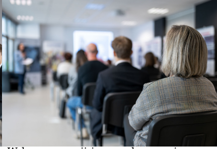
„W kręgu poezji i prozy lagrowej więźniarek KL Ravensbrück im. Wandy Póltawskiej”.