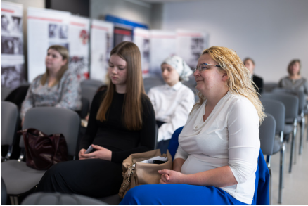
„W kręgu poezji i prozy lagrowej więźniarek KL Ravensbrück im. Wandy Póltawskiej”.