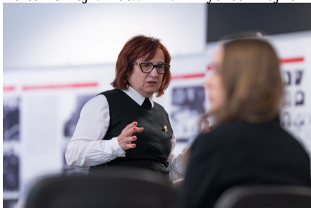
„W kręgu poezji i prozy lagrowej więźniarek KL Ravensbrück im. Wandy Półtawskiej”.