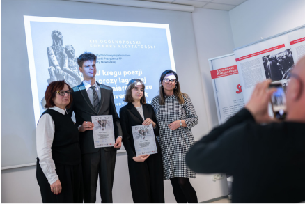
„W kręgu poezji i prozy lagrowej więźniarek KL Ravensbrück im. Wandy Póltawskiej”.