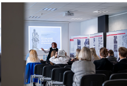
„W kręgu poezji i prozy lagrowej więźniarek KL Ravensbrück im. Wandy Półtawskiej”.