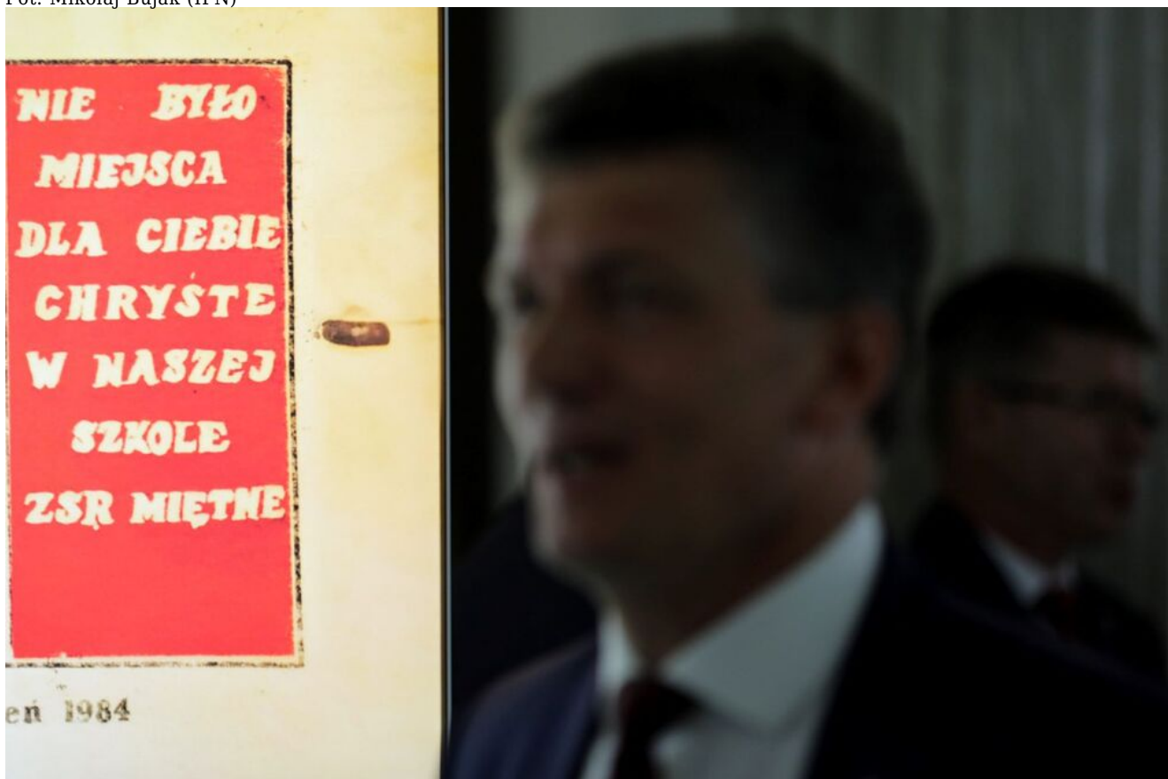
Wystawa „Obrona krzyża w Zespole Szkół Rolniczych w Miętmem w 1984 r.” w Sejmie RP - Warszawa, 12 czerwca 2024.