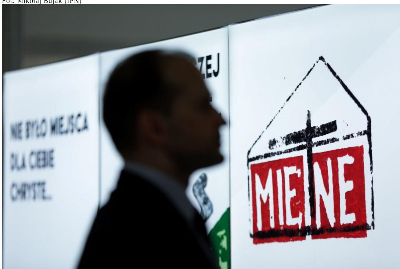
Wystawa „Obrona krzyża w Zespole Szkół Rolniczych w Miętmem w 1984 r.” w Sejmie RP - Warszawa, 12 czerwca 2024.