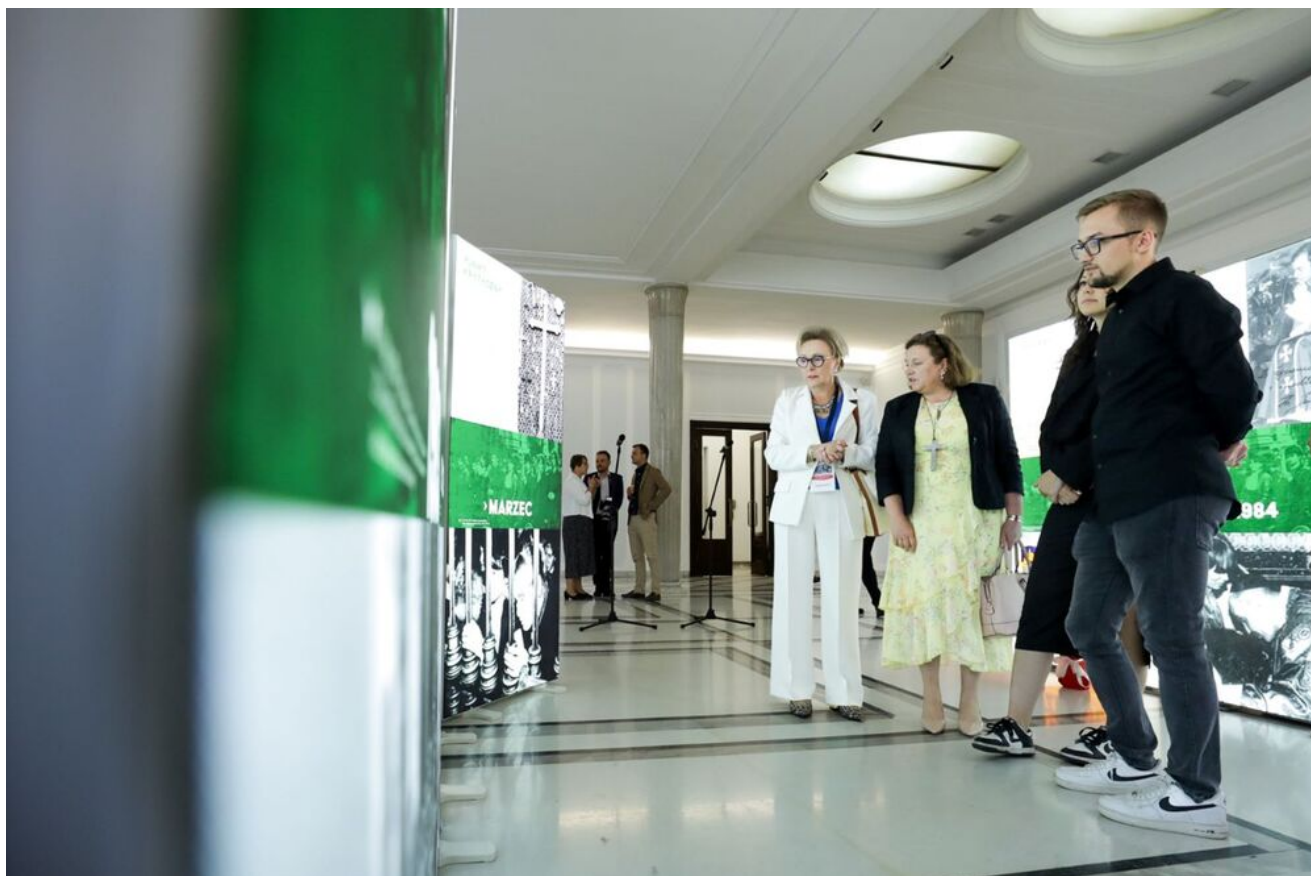
Wystawa „Obrona krzyża w Zespole Szkół Rolniczych w Miętym w 1984 r.” w Sejmie RP - Warszawa, 12 czerwca 2024.