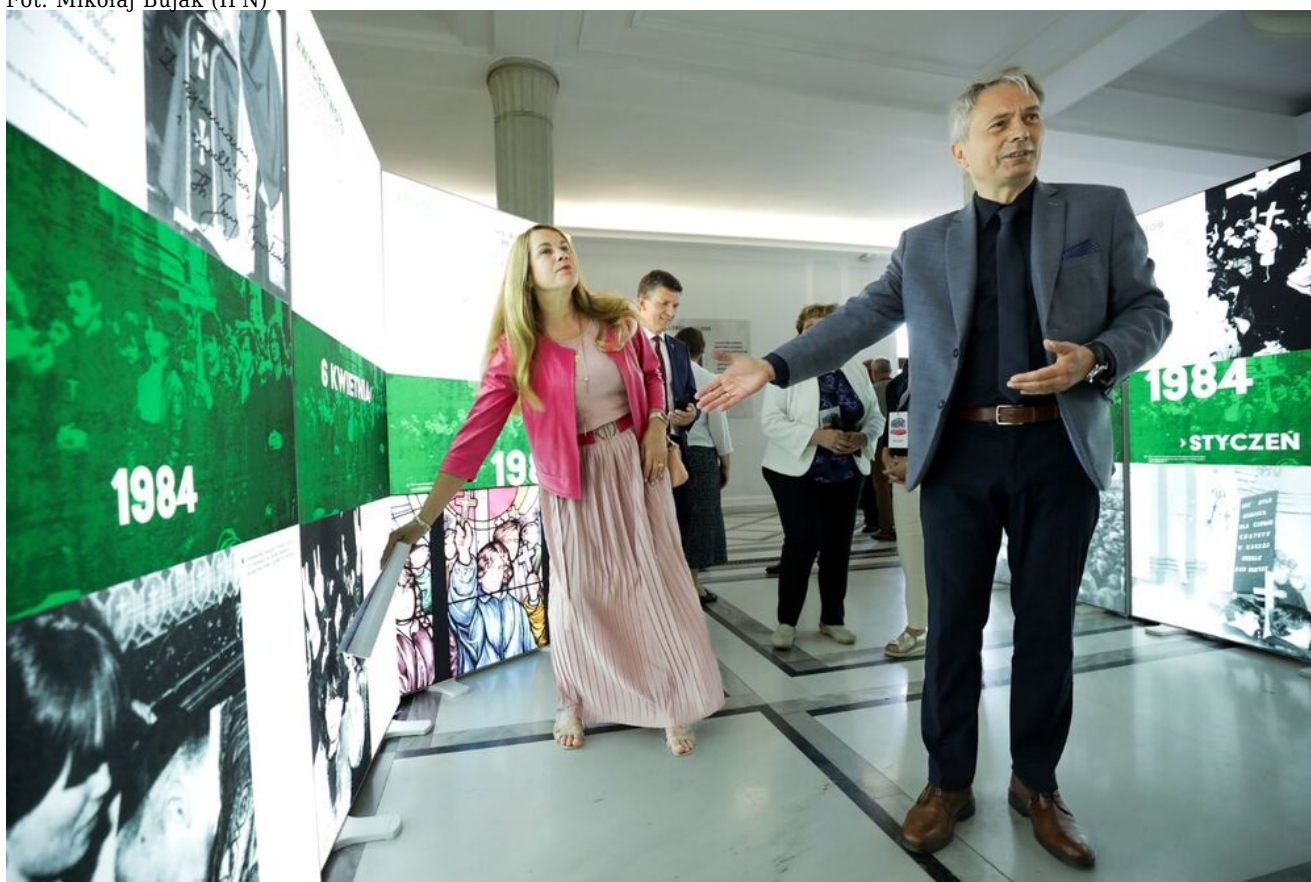
Wystawa „Obrona krzyża w Zespole Szkół Rolniczych w Miętym w 1984 r.” w Sejmie RP - Warszawa, 12 czerwca 2024.

Wystawa „Obrona krzyża w Zespole Szkół Rolniczych w Miętym w 1984 r”