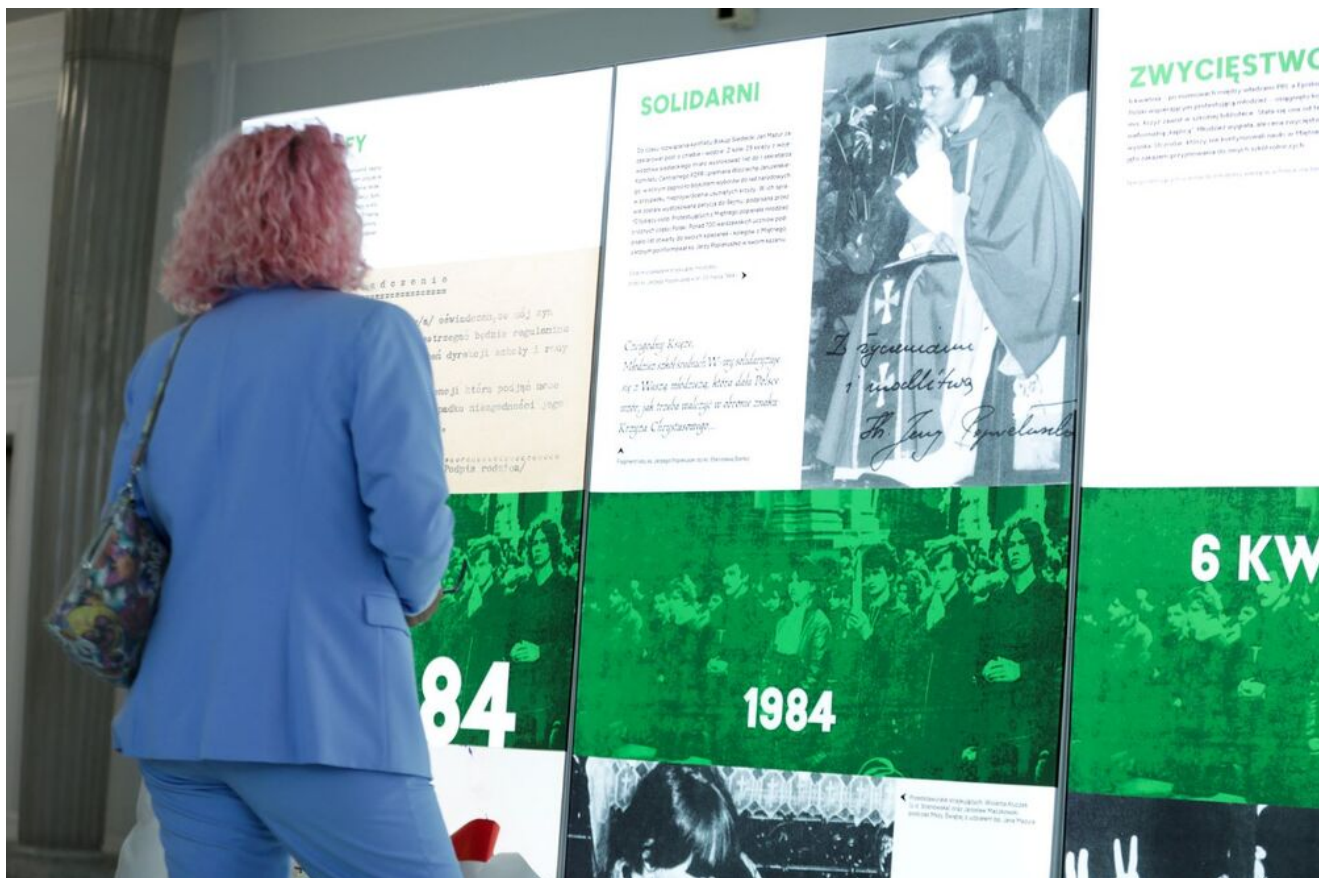
Wystawa „Obrona krzyża w Zespole Szkół Rolniczych w Miętmem w 1984 r.” w Sejmie RP - Warszawa, 12 czerwca 2024.