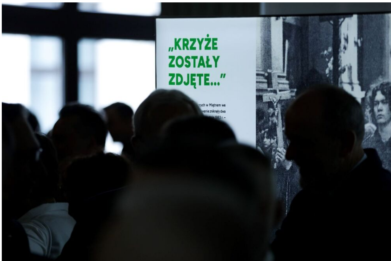
Wystawa „Obrona krzyża w Zespole Szkół Rolniczych w Miętmem w 1984 r.” w Sejmie RP - Warszawa, 12 czerwca 2024.