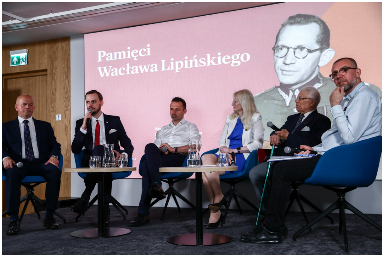
Dyskusja po filmie „Skazany na zapomnienie. Wacław Lipiński”.