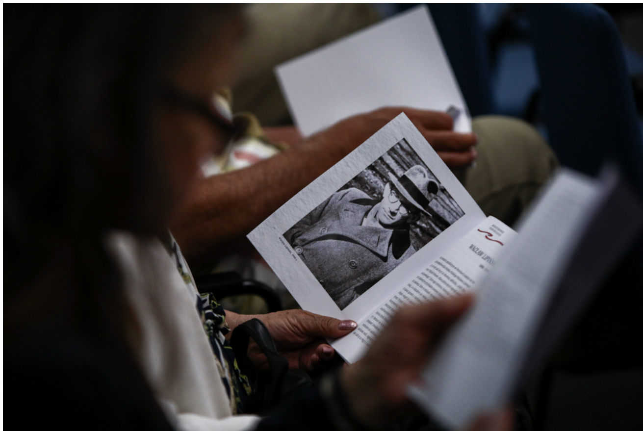
Dyskusja po filmie „Skazany na zapomnienie. Waław Lipiński”.