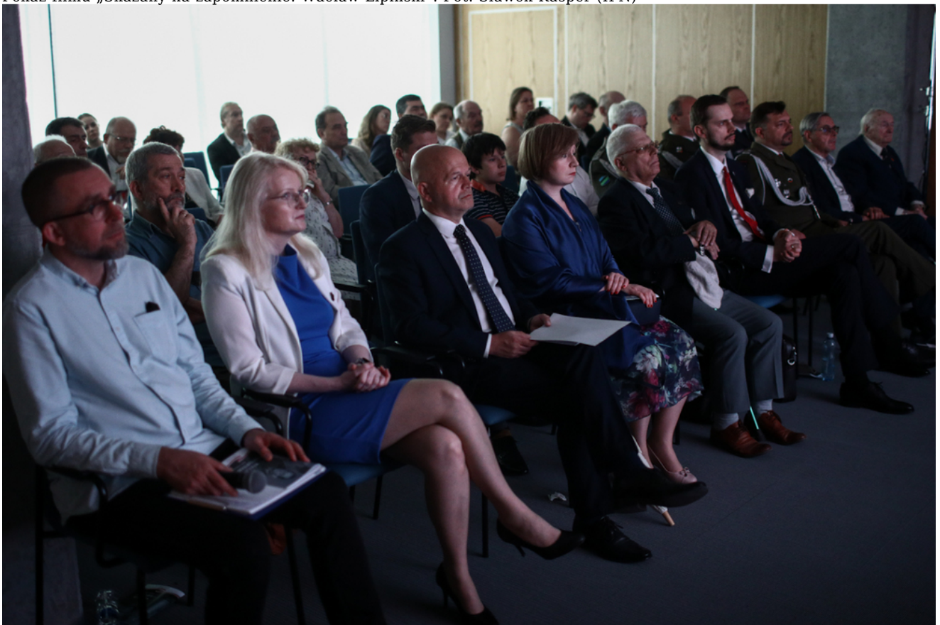
Pokaz filmu „Skazany na zapomnienie. Waclaw Lipiński”.