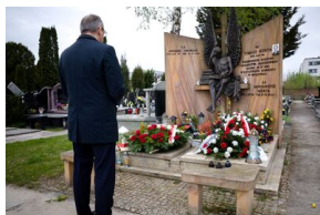
Uroczystości upamiętniające ofiary katastrofy smoleńskiej – 10 kwietnia 2024.