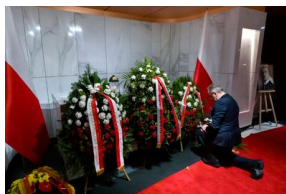
Uroczystości upamiętniające ofiary katastrofy smoleńskiej – 10 kwietnia 2024.