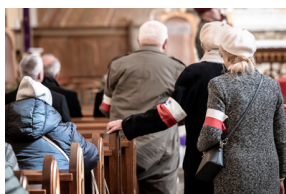
Pogrzeb śp. Władysława Guzdkę ps. „Wilk” – Czechnowice-Dziedzice, 21 marca 2024.