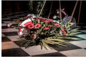
Pogrzeb śp. Władysława Guzdka ps. „Wilk” – Czechowice-Dziedzice, 21 marca 2024.