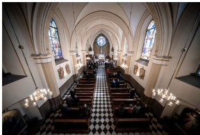
Pogrzeb śp. Władysława Guzdka ps. „Wilk” – Czechowice-Dziedzice, 21 marca 2024.