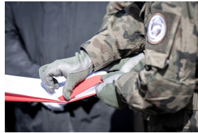
Pogrzeb śp. Władysława Guzdka ps. „Wilk” – Czechowice-Dziedzice, 21 marca 2024.