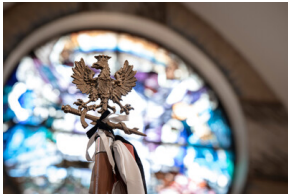
Pogrzeb śp. Władysława Guzdka ps. „Wilk” – Czechowice-Dziedzice, 21 marca 2024.