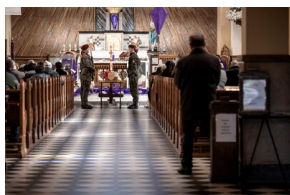
Pogrzeb śp. Władysława Guzdka ps. „Wilk” – Czechowice-Dziedzice, 21 marca 2024.