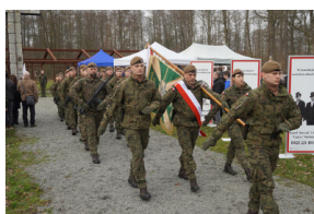
Obchody Narodowego Dnia Pamięci Żołnierzy Wyklętych – Stary Grodków, 1 marca 2024.