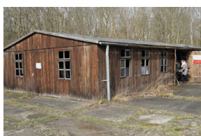
Obchody Narodowego Dnia Pamięci Żołnierzy Wyklętych – Stary Grodków, 1 marca 2024.