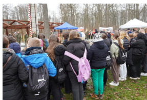
Obchody Narodowego Dnia Pamięci Żołnierzy Wyklętych – Stary Grodków, 1 marca 2024.