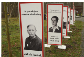
Obchody Narodowego Dnia Pamięci Żołnierzy Wyklętych – Stary Grodków, 1 marca 2024.