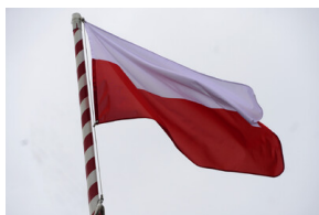
Obchody Narodowego Dnia Pamięci Żołnierzy Wyklętych – Stary Grodków, 1 marca 2024.