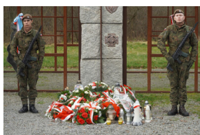
Obchody Narodowego Dnia Pamięci Żołnierzy Wyklętych – Stary Grodków, 1 marca 2024.