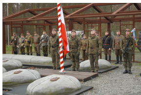
Obchody Narodowego Dnia Pamięci Żołnierzy Wyklętych – Stary Grodków, 1 marca 2024.