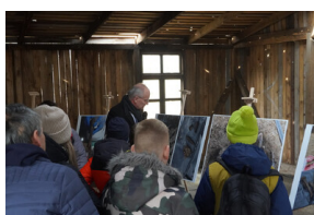
Obchody Narodowego Dnia Pamięci Żołnierzy Wyklętych – Stary Grodków, 1 marca 2024.