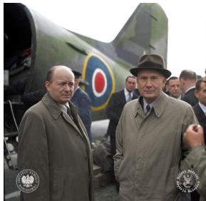
Stanisław Mikołajczyk, przywódca Stronnictwa Ludowego został premierem RP po tragicznej śmierci gen. Sikorskiego w Gibraltarze. Na zdjęciu premier Mikołajczyk (po lewej) w towarzystwie wicepremiera Jana Kwapińskiego po powrocie z wizyty w ZSRS, sierpień 1944 r.