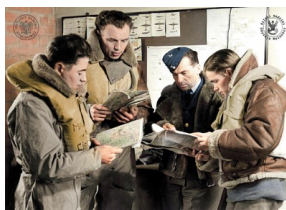
Lotnicy Polskich Sił Powietrznych podczas odprawy przed kolejnym lotem. Lata 1940-1945