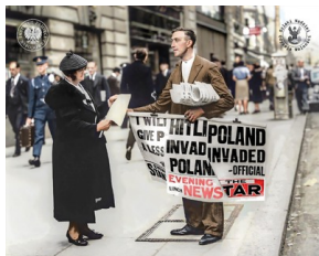
Londyn, 1939 r.