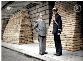
Burmistrz Londynu Frank Bowater i nieznaną policjant. Londyn, 1 września 1939 r.