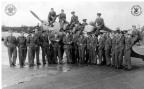
Grupa polskich pilotów 303 Dywizjonu Myśliwskiego stoi wokół samolotu Supermarine Spitfire, prawdopodobnie lotnisko Speke, 1941 r.