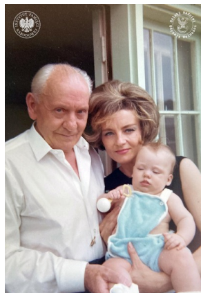
Generał Stanisław Maczek z córką Renatą i wnuczką Karoliną, Chicago, USA, maj 1965 r.