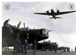
Piloci i personel naziemny 300. Dywizjonu Bombowego Ziemi Mazowieckiej Polskich Sił Powietrznych przy samolotach bombowych Vickers Wellington Mk. X na lotnisku w bazie RAF Hemswell (Lincolnshire), 1943 r.