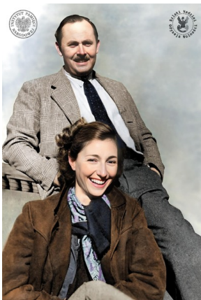
Krystyna Skarbek i mjr Andrzej Kowerski (pseud. Andrew Kennedy). Kowerski w 1939 r. walczył w zmotoryzowanej 10. Brygadzie Kawalerii Wojska Polskiego dowodzonej przez gen. Stanisława Maczka

Krystyna Skarbek została zdemobilizowana w Kairze w kwietniu 1945 r. Po wojnie pracowała jako pokojówka w hotelu, telefonistka, sprzedawczyni w londyńskim domu towarowym Harrods i stewardesa na statkach pasażerskich. Prawdopodobnie to właśnie ją Ian Fleming ukazał jako Vesper Lynd w swojej pierwszej powieści o Jamesie Bondzie - Casino Royale. Krystyna Skarbek została zamordowana 15 czerwca 1952 r.