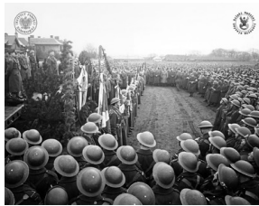
Żołnierze I Korpusu Polskiego w Szkocji, 1943 r.