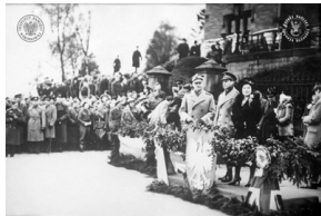
Król Wielkiej Brytanii Jerzy VI i królowa Elżbieta wraz z gen. Władysławem Sikorskim przyjmują defiladę 10 Brygady Kawalerii Pancerniej, marzec 1941 r.