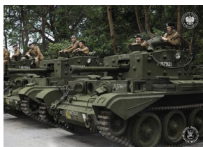
Czołgi typu Cromwell IV 1 Dywizji Panczernej. Widoczny dowódca Dywizji – generał Stanisław Maczek (drugi od prawej). Scarborough w północno-wschodniej Anglii, lipiec 1944 r.