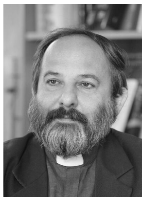
Ksiądz Tadeusz Isakowicz-Zaleski