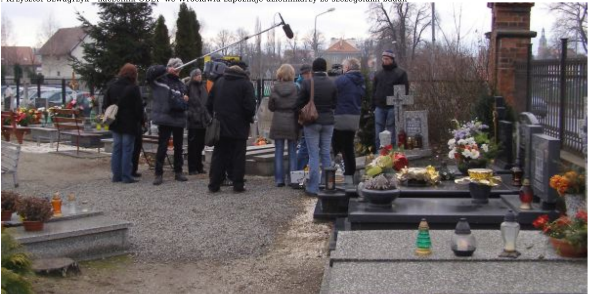
Cmentarz w Dzierżoniowie - poszukiwania mogił żołnierzy AK spotkały się z dużym zainteresowaniem mediów