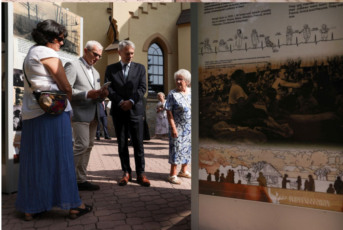
Otwarcie wystawy „Śmierć za człowieczeństwo. Rodzina Ulmów” – Markowa, 9 września 2023.