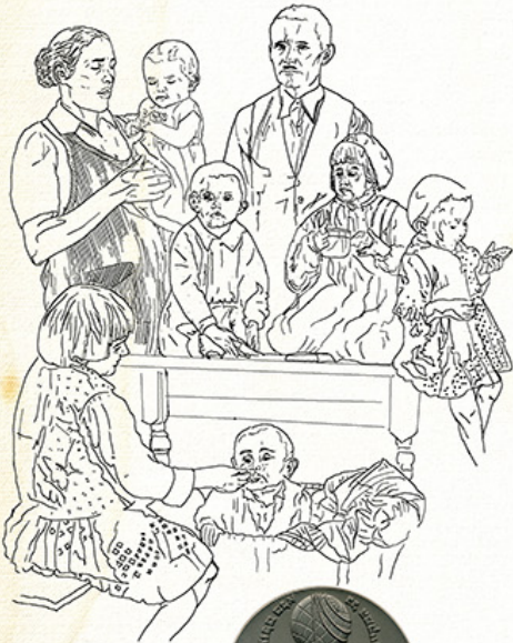
Dyplom honorowy oraz medal Sprawiedliwy wśród Narodów Świata przyznany pośmiertnie 13 IX 1995 r. Józefowi i Wiktorii Ulmow przez Instytut Yad Vashem w Jerozolimie. The Righteous Among the Nations honorary Diploma and medal awarded posthumously on September 13, 1995 to Józef and Wiktorii Ulma by the Yad Vashem Institute in Jerusalem.

On December 17, 2022, Pope Francis approved the decree recognizing the martyrdom of the Ulma family, consenting to their beatification. Earlier, the Ulma Family Museum of Poles Saving Jews in World War II was opened in Markowa. In Israel, the Ulmas were posthumously awarded the Righteous Among the Nations title. From 2018, in Poland, the day of March 24 (the anniversary of the Ulma family murder) is the National Day of Remembrance of Poles Saving Jews under German occupation.