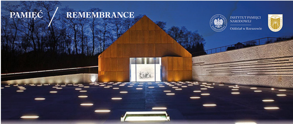
Muzeum Polaków Ratujących Żydów podczas II wojny światowej im. Rodziny Ulmów w Markowej. Jest pierwszą i jedyną w Polsce placówką muzealną zajmującą się wyłącznie tematyką ratowania ludności żydowskiej przez Polaków na okupowanych ziemiach polskich podczas Zagłady. The Ulma Family Museum of Poles Saving Jews in World War II in Markowa. It is the first and the only museum that is devoted exclusively to the subject of saving Jews by Poles in the occupied Polish territory during the Holocaust.