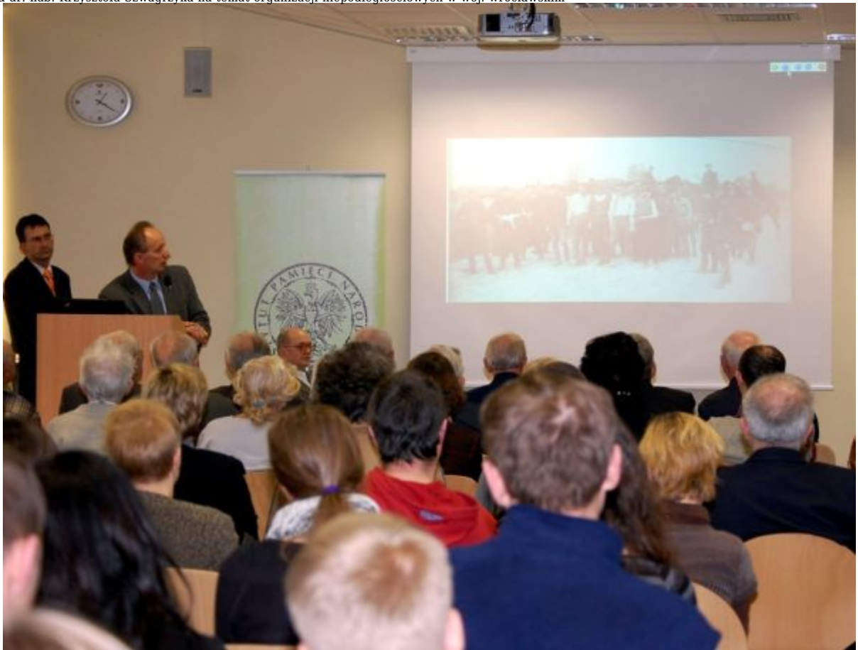
Prezentacja multimedialna towarzysząca wykładowi budziła zainteresowanie zwłaszcza wśród młodzieży