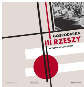
Otwarcie wystawy IPN „Gospodarka III Rzeszy” – Szczecin, 9 czerwca 2023