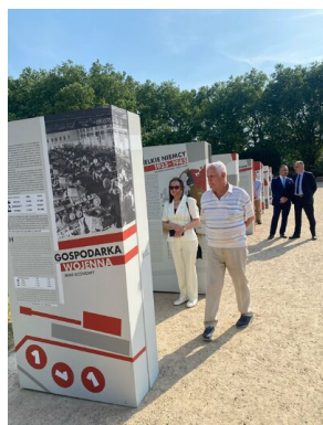
Otwarcie wystawy IPN „Gospodarka III Rzeszy” w Szczecinie – 9 czerwca 2023.

Po raz pierwszy wystawę zaprezentowano w Warszawie w styczniu 2023 r. Następnie mogli ją oglądać mieszkańcy Gdańska, Poznańa i Wrocławia.