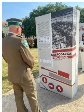
Otwarcie wystawy IPN „Gospodarka III Rzeszy” w Szczecinie – 9 czerwca 2023.

Koncepcja wystawy: dr Karol Nawrocki, prezes IPN