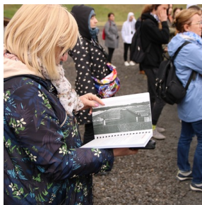
Wyjazd finalistów konkursu „W kręgu pamięci i prozy lagrowej więźniarek KL Ravensbrück”. Fot.