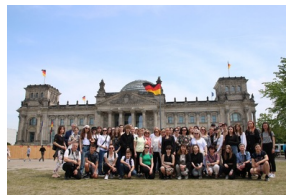
Wyjazd finalistów konkursu „W kręgu pamięci i prozy lagrowej więźniarek KL Ravensbrück”.