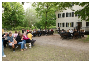
Wyjazd finalistów konkursu „W kręgu pamięci i prozy lagrowej więźniarek KL Ravensbrück”.