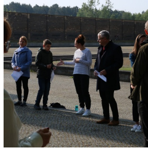
Wyjazd finalistów konkursu „W kręgu pamięci i prozy lagrowej więźniarek KL Ravensbrück”.