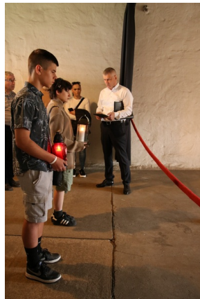
Wyjazd finalistów konkursu „W kręgu pamięci i prozy lagrowej więźniarek KL Ravensbrück”.