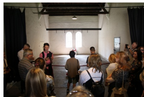
Wyjazd finalistów konkursu „W kręgu pamięci i prozy lagrowej więźniarek KL Ravensbrück”.