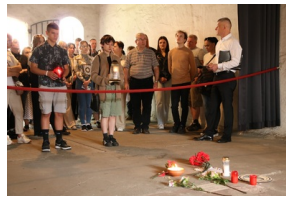
Wyjazd finalistów konkursu „W kręgu pamięci i prozy lagrowej więźniarek KL Ravensbrück”.