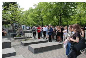
Wyjazd finalistów konkursu „W kręgu pamięci i prozy lagrowej więźniarek KL Ravensbrück”.