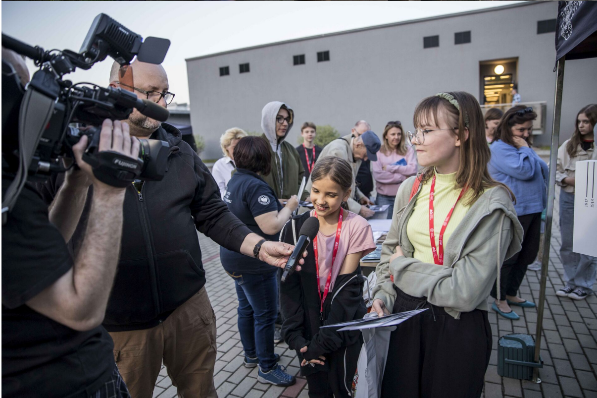
Noc Muzeów z Archiwum IPN – Strefa nowych technologii – Warszawa, 13 maja 2023.