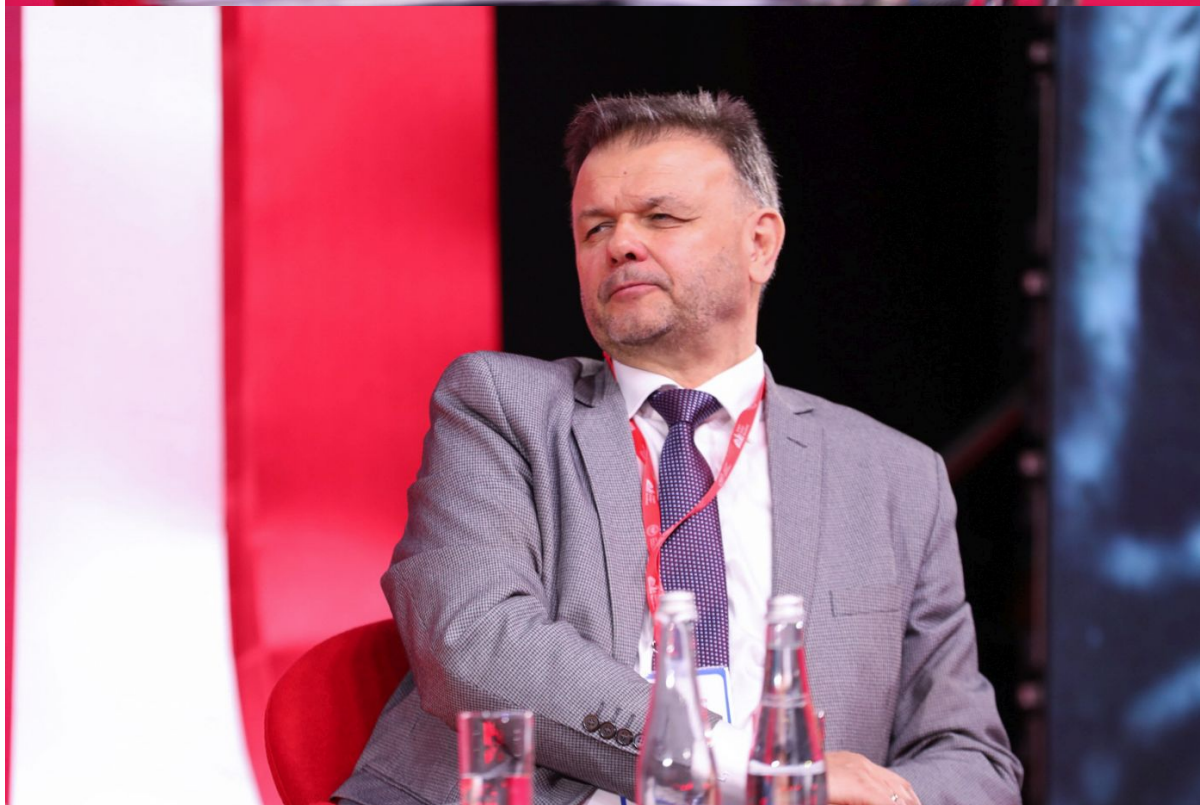
Panel dyskusyjny „Edukacja dla pamięci” podczas Kongresu Pamięci Narodowej – Warszawa, 13 kwietnia 2023.