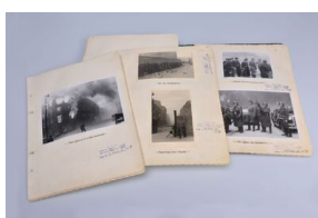
„Raport Stroopa” z zasobu Instytutu Pamięci Narodowej