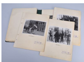
„Raport Stroopa”