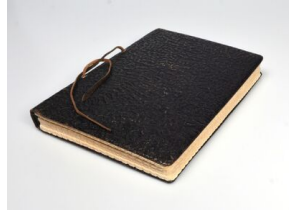
„Raport Stroopa“ z zasobu Instytutu Pamięci Narodowej