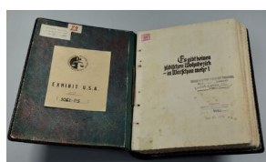
„Raport Stroopa” z zasobu Instytutu Pamięci Narodowej