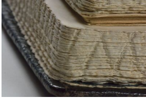
„Raport Stroopa“ z zasobu Instytutu Pamięci Narodowej