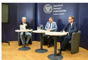
Spotkanie na „Przystanku Historia” IPN w Krakowie poświęcone słownikowi inteligencji polskiej w ZSRS.