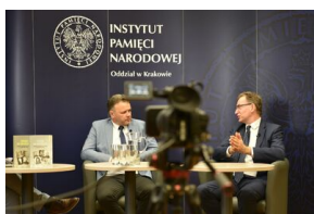
Spotkanie na „Przystanku Historia” IPN w Krakowie poświęcone słownikowi inteligencji polskiej w ZSRS.