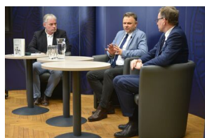
Spotkanie na „Przystanku Historia” IPN w Krakowie poświęcone słownikowi inteligencji polskiej w ZSRS.