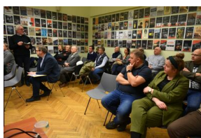
Spotkanie na „Przystanku Historia” IPN w Krakowie poświęcone słownikowi inteligencji polskiej w ZSRS.