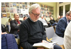
Spotkanie na „Przystanku Historia” IPN w Krakowie poświęcone słownikowi inteligencji polskiej w ZSRS.