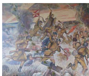
Kościół w Sołach. Fresk przedstawiający zwycięstwo nad bolszewikami w Bitwie Warszawskiej