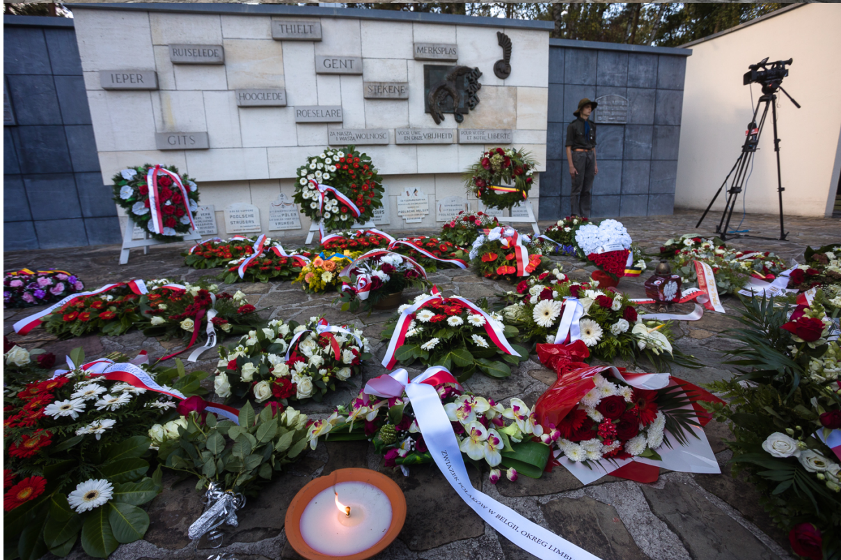
78. rocznica wyzwolenia Belgii przez 1. Dywizję Pancerną – Lommel, 25 września 2022.