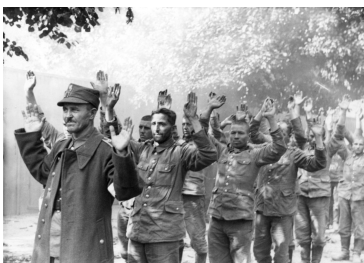
Obrońcy Westerplatte po kapitulacji odprowadzani do niewoli. 7 września 1939 r.