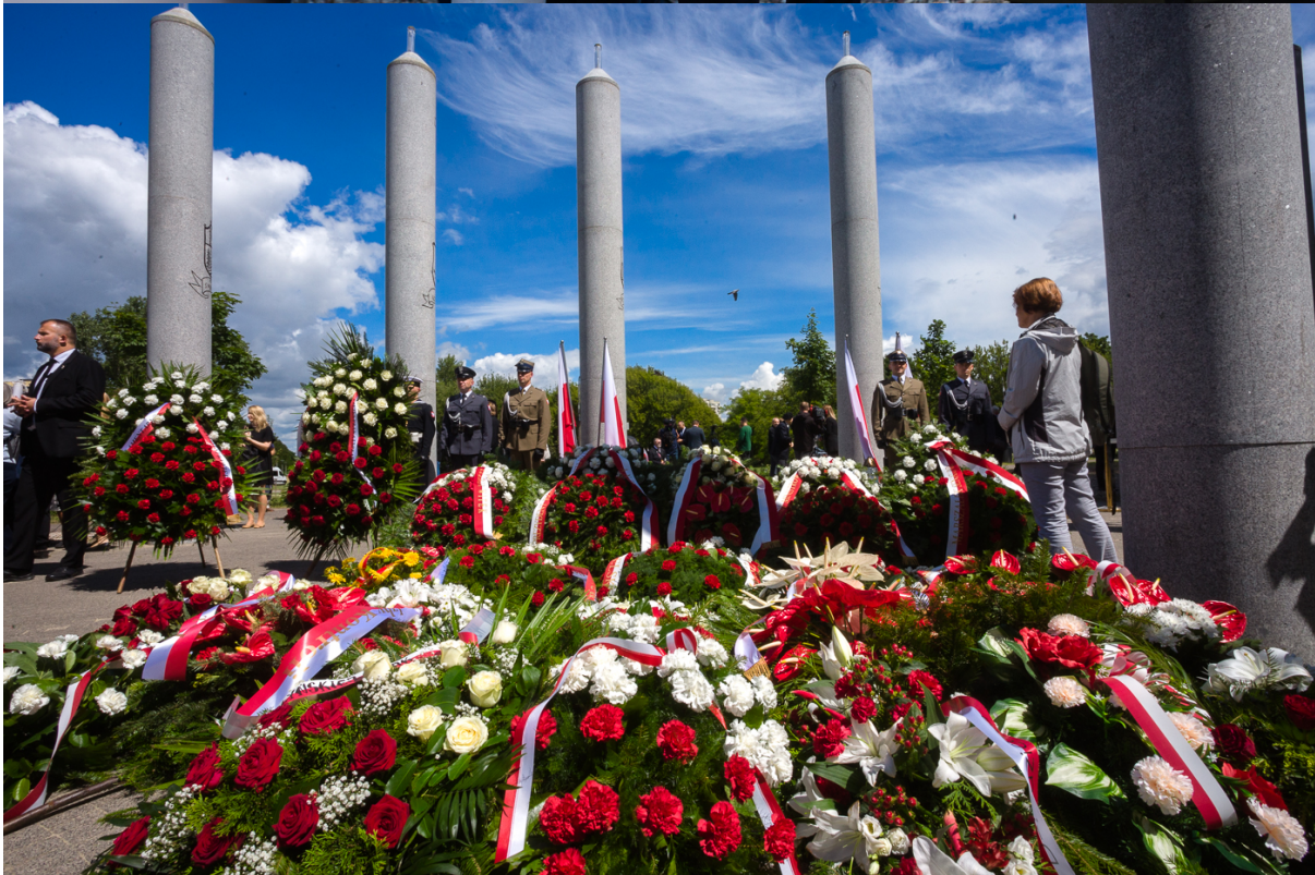
Msza św. w intencji ofiar ludobójstwa dokonanego przez ukraińskich nacjonalistów na obywatelach II RP oraz poległych, zmarłych i żyjących żołnierzy 27. Wołyńskiej Dywizji Piechoty Armii Krajowej – Warszawa, 11 lipca 2022. Fot. Mateusz Niegowski (IPN) Msza św. w intencji ofiar ludobójstwa dokonanego przez ukraińskich nacjonalistów na obywatelach II RP oraz poległych, zmarłych i żyjących żołnierzy 27. Wołyńskiej Dywizji Piechoty Armii Krajowej – Warszawa, 11 lipca 2022. Fot. Mateusz Niegowski (IPN) Msza św. w intencji ofiar ludobójstwa dokonanego przez ukraińskich nacjonalistów na obywatelach II RP oraz poległych, zmarłych i żyjących żołnierzy 27. Wołyńskiej Dywizji