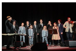
Rodzina Brodów, fot. Rafał Gasiński