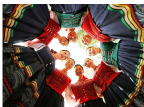
Łemkowski Zespół Pieśni i Tańca Łastiwoczka