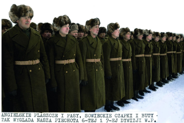
ANGIELSKIE FLASZCZKI I PASY, SOWIETSKIE CZAPKI I BUTY - TAK WYGLĄDA NASZA PISZCZOTA 6-TEJ I 7-SJ DYWIZJI W.P.