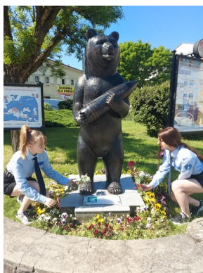
Miejsce pamięci