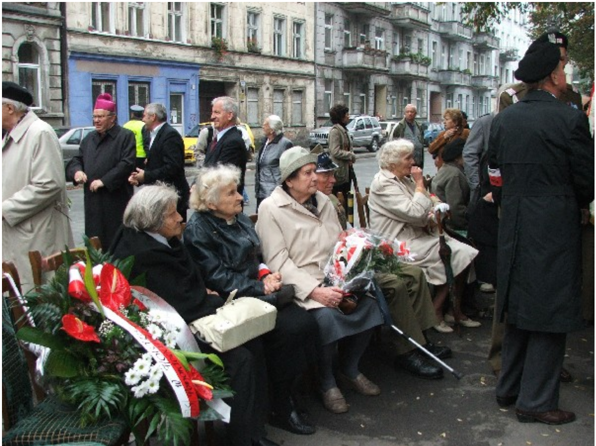
Zgromadzeni na uroczystości kombatanci i więźniowie okresu stalinowskiego