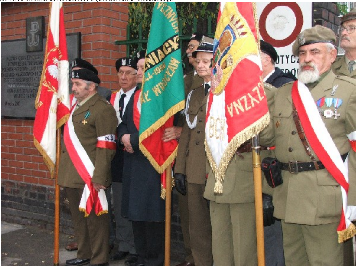
Poczty sztandarowe środowisk kombatanckich