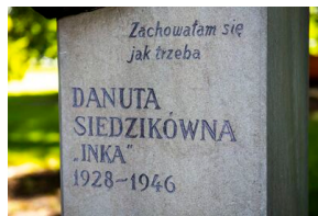
W Krakowie uczczono 75. rocznicę śmierci Danuty Siedzikówny „Inki”.