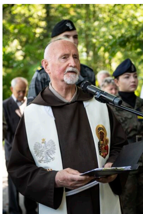
W Krakowie uczczono 75. rocznicę śmierci Danuty Siedzikówny „Inki”.