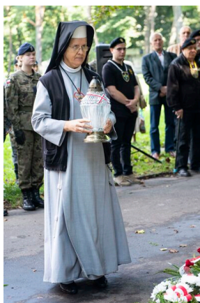
W Krakowie uczczono 75. rocznicę śmierci Danuty Siedzikówny „Inki”.