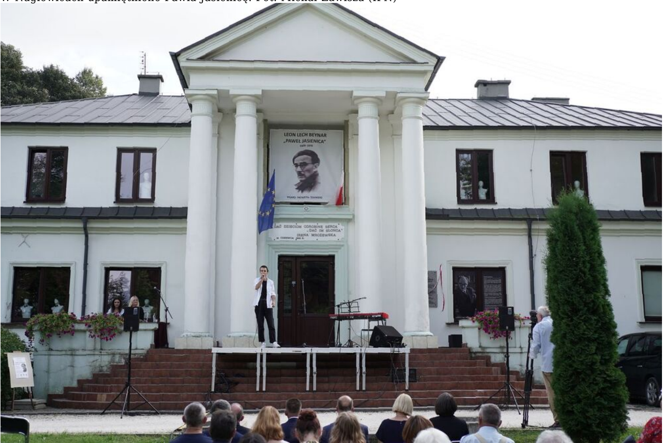
W Nagłowicach upamiętniono Pawła Jasienicę.