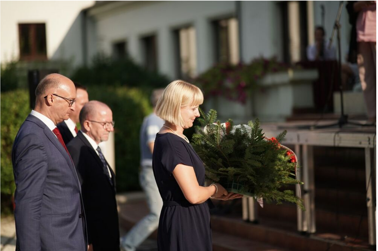
W Nagłowicach upamiętniono Pawła Jasienicę.