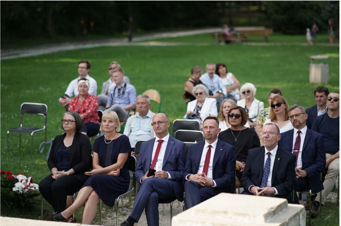
W Nagłowicach upamiętniono Pawła Jasienicę.