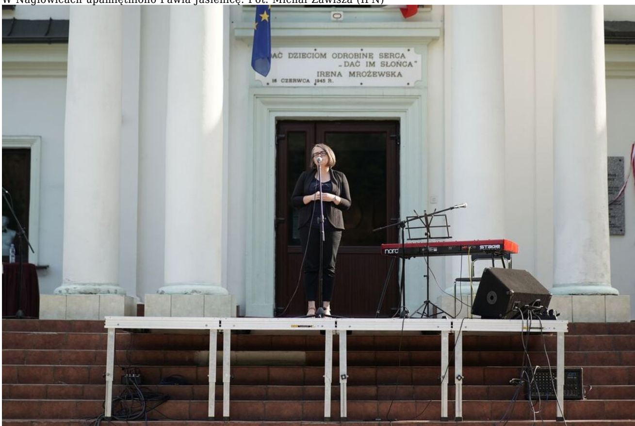
W Nagłowicach upamiętniono Pawła Jasienicę.