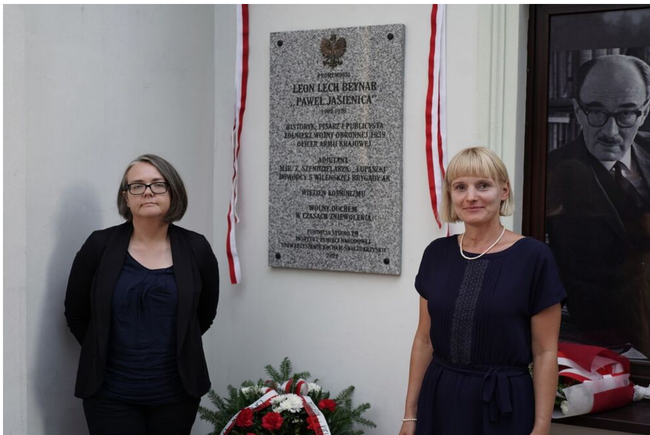
W Nagłowicach upamiętniono Pawła Jasienicę.