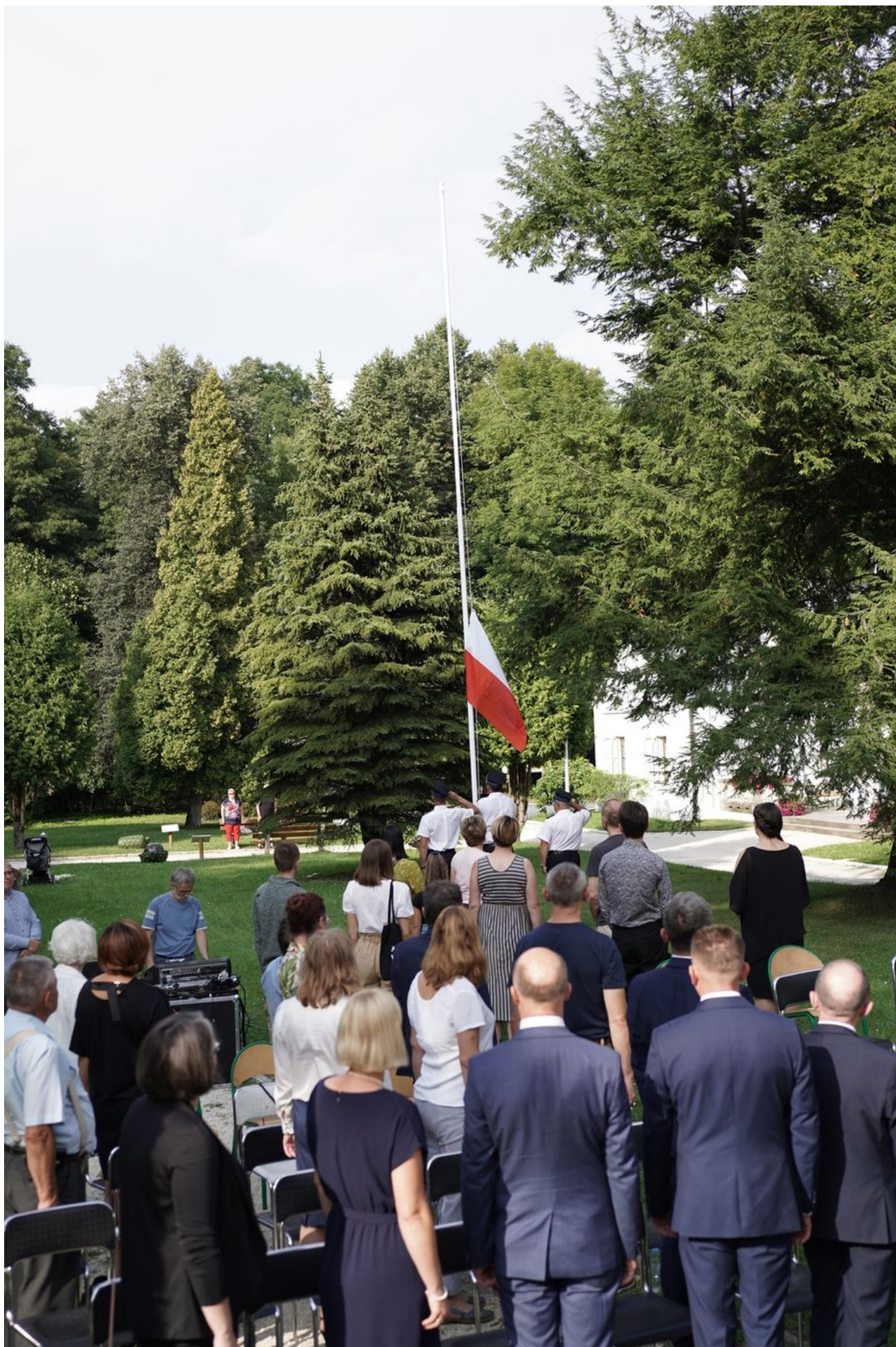
W Nagłowicach upamiętniono Pawła Jasienicę.