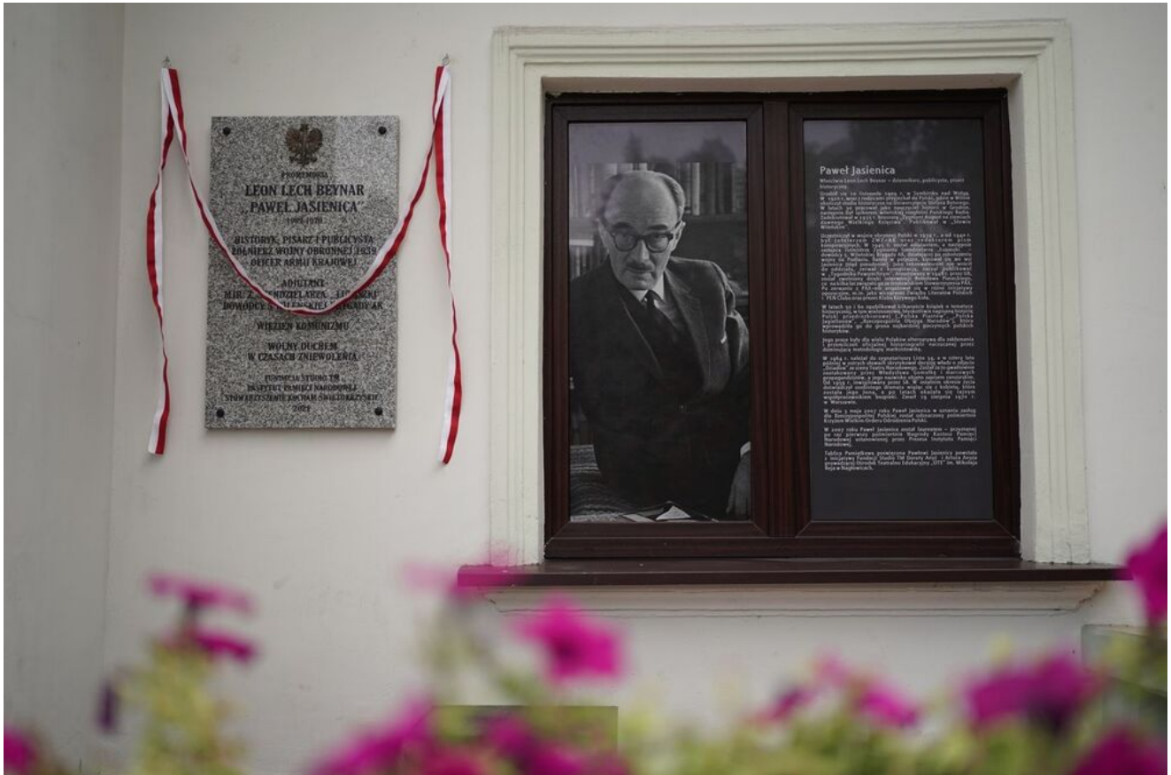
W Nagłowicach upamiętniono Pawła Jasienicę.