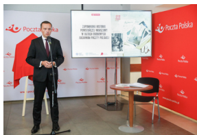
Tomasz Zdzikot, prezes zarządu Poczty Polskiej.