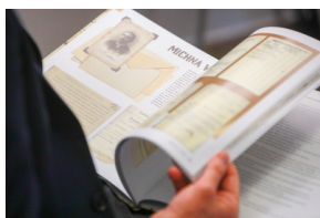
Prezentacja albumu pt.: „Zapomniana Historia Powstańczej Warszawy w Aktach Osobowych Archiwum Poczty Polskiej”. Warszawa, 6 sierpnia 2021.