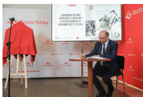
Prezentacja albumu pt.: „Zapomniana Historia Powstańczej Warszawy w Aktach Osobowych Archiwum Poczty Polskiej”. Warszawa, 6 sierpnia 2021.