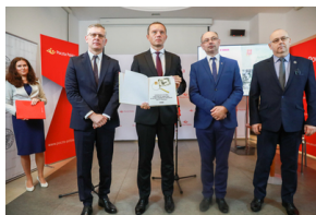
Prezentacja albumu pt.: „Zapomniana Historia Powstańczej Warszawy w Aktach Osobowych Archiwum Poczty Polskiej”. Warszawa, 6 sierpnia 2021.