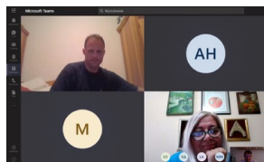
Podsumowanie seminarium z historii Polski XX wieku dla nauczycieli i edukatorów „Poland in the Heart of European History” - 18-29 lipca 2021.

Z uwagi na pandemię COVID-19 seminarium zostało przeprowadzone w formacie online.