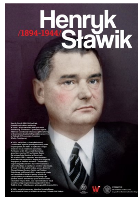
Plakat IPN - Henryk Sławik.