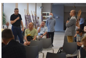
Kielce, 10.07.2021. Konferencja naukowa o martyrologii wsi polskiej.