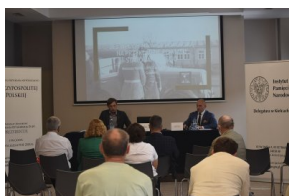
Kielce, 10.07.2021. Konferencja naukowa o martyrologii wsi polskiej.