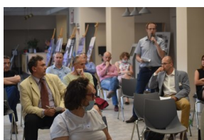
Kielce, 10.07.2021. Konferencja naukowa o martyrologii wsi polskiej.

Spotkanie poświęcone było problematyce ofiar najokrutniejszych represji i ich losów, rzeczywistości po pacyfikacjach, procesie odbudowy spalonych wsi. W centrum uwagi znalazł się człowiek – świadek niemieckiego i sowieckiego okrucieństwa. Symbolicznym miejscem upamiętnienia martyrologii wszystkich miejscowości spacyfikowanych podczas II wojny światowej stał się Michniów w woj. świętokrzyskim.