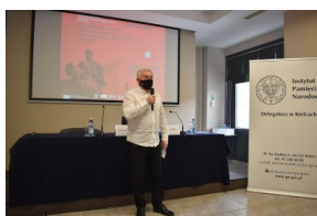
Kielce, 10.07.2021. Konferencja naukowa o martyrologii wsi polskiej.