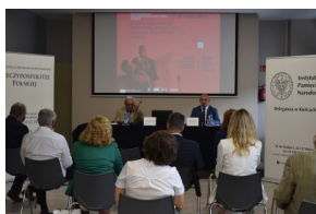
Kielce, 10.07.2021. Konferencja naukowa o martyrologii wsi polskiej.