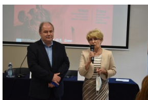
Kielce, 10.07.2021. Konferencja naukowa o martyrologii wsi polskiej.

10 lipca 2021 r. w Centrum Edukacyjnym „Przystanek Historia” IPN w Kielcach odbyła się konferencja naukowa zorganizowana w ramach obchodów Dnia Walki i Męczeństwa Wsi Polskiej.