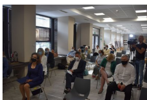
Kielce, 10.07.2021. Konferencja naukowa o martyrologii wsi polskiej.