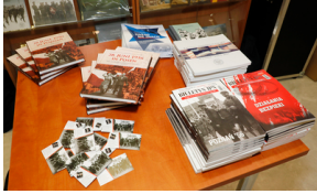
Briefing prasowy poświęcony obcojęzycznym publikacjom IPN w 65. rocznicę Czerwca '56 – 24 czerwca 2021.

Publikacja powstała dzięki współpracy Instytutu Pamięi Narodowej Oddział w Poznaniu oraz Wydziału Historii UAM w Poznaniu.