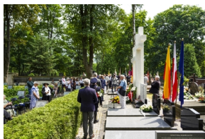
poświęcenie Symbolicznej Mogiły Sybirackiej – Warszawa, 23 czerwca 2021.