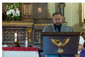
Biogram zmarłego kombatanta przybliżył Paweł Skrók z IPN Lublin.