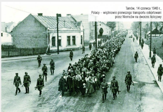
Tarnów, 14 czerwca 1940 r., Polacy – więźniowie pierwszego transportu eskortowani przez Niemców na dworzec kolejowy

Wśród nich byli ci, którzy wywalczyli niepodległość po zaborczej niewoli: od żołnierzy I Kompanii Kadrowej po uczestników wojny polsko-bolszewickiej, a także tworzący już odrodzoną Ojczyznę: działacze społeczni, naukowcy, ludzie kultury, kapłani, oficerowie, sportowcy, ministrowie, prezydenci miast, politycy wszystkich ugrupowań II Rzeczypospolitej – od Polskiej Partii Socjalistycznej po Obóz Narodowo-Radykalny. Kilkunastu zamęczonych w obozie duchownych wyniesiono na ołtarze. Ich symbolem jest św. ojciec Maksymilian Maria Kolbe, który oddał życie za współwięźnia. Do dzisiaj poruszają świadectwa pozostawione przez twórców obozową konspirację – z więźniem nr 4859 Witoldem Pileckim na czele. Nie można przejść obojętnie wobec historii położonej Stanisławy Leszczyńskiej. W nieludzkich warunkach pomogła przysiąc na świat ponad trzem tysiącom dzieci. Wbrew niemieckim rozkazom i przy braku elementarnych warunków higienicznych ani jedno z nich nie zmarło w czasie porodu. Nie policzymy wszystkich takich postaw, ale to dzięki tym ludziom zło nie zwyciężyło w piekle zbudowanym przez człowieka.