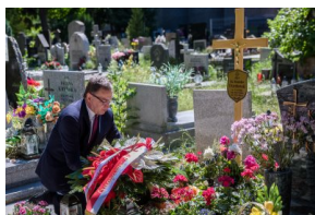
Przy grobie ks. Stanisława Orzechowskiego