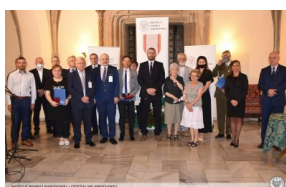
Wręczenie Nagrody IPN „Świadek Historii”