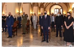
Wręczenie Nagrody IPN „Świadek Historii”