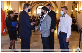
Wręczenie Nagrody IPN „Świadek Historii” Lokalnej Grupy Zwiadowców Historii z Jelcza-Laskowic.