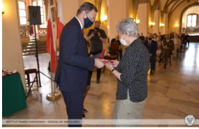
Wręczenie Nagrody IPN „Świadek Historii” Dolnośląskiej Rodzinie Katyńskiej