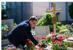
Przy grobie ks. Stanisława Orzechowskiego