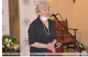
Podziękowania od Dolnośląskiej Rodziny Katyńskiej