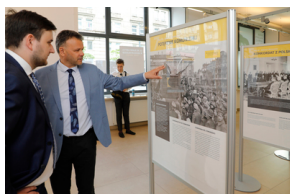
Otwarcie wystawy „Pius XI - bohater Warszawy” - 31 maja 2021.

Życie i działalność Ojca Świętego Piusa XI oraz jego wpływ na kształtowanie się Kościoła w odrodzonej Polsce ukazuje wystawa, którą można oglądać w Centrum Edukacyjnym IPN Przystanek Historia przy ul. Marszałkowskiej 21/25 w Warszawie. Ekspozycja będzie czynna od 31 maja do 30 czerwca 2021 r.