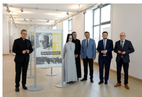
Otwarcie wystawy „Pius XI - bohater Warszawy” - 31 maja 2021.