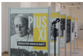
Otwarcie wystawy „Pius XI - bohater Warszawy” - 31 maja 2021.