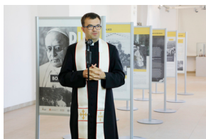
Otwarcie wystawy „Pius XI - bohater Warszawy” - 31 maja 2021.