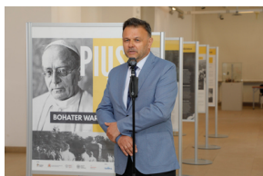
Otwarcie wystawy „Pius XI - bohater Warszawy” - 31 maja 2021.