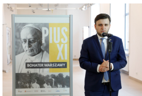
Otwarcie wystawy „Pius XI - bohater Warszawy” - 31 maja 2021.