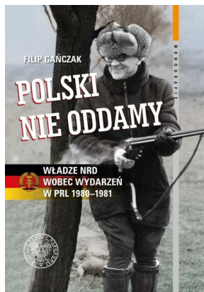
Polski nie oddamy. Władze NRD wobec wydarzeń w PRL 1980-1981

Dyskusja odbywała się w ramach „Leipzig liest extra”, czyli wirtualnej namiastki Lipskich Targów Książki.