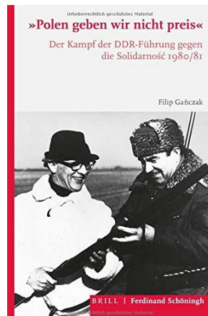
Polen geben wir nicht preis