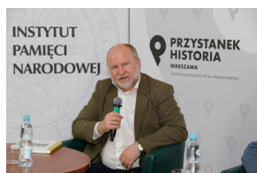
Rozmowa online „Banknoty polskiego podziemia” – 24 maja 2021.