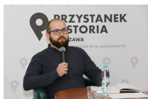
Rozmowa online „Banknoty polskiego podziemia” – 24 maja 2021.

Transmisja odbyła się 24 maja (poniedziałek) o godz. 15.00 na kanale IPNtv .