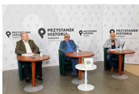
Rozmowa online „Banknoty polskiego podziemia” – 24 maja 2021.