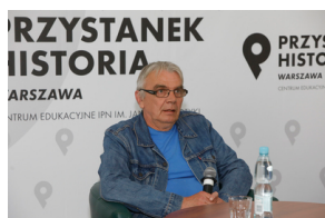
Rozmowa online „Banknoty polskiego podziemia” – 24 maja 2021.