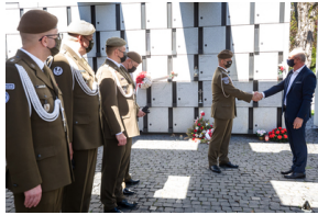
Przedstawiciele 4. Warmińsko-Mazurskiej Brygady Obrony Terytorialnej na powązkowskiej „Łączce” - 11 maja 2021.