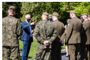
Przedstawiciele 4. Warmińsko-Mazurskiej Brygady Obrony Terytorialnej na powązkowskiej „Łączce” - 11 maja