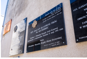
Przedstawiciele 4. Warmińsko-Mazurskiej Brygady Obrony Terytorialnej na powązkowskiej „Łączce” - 11 maja 2021.