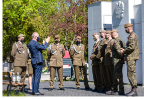
Przedstawiciele 4. Warmińsko-Mazurskiej Brygady Obrony Terytorialnej na powązkowskiej „Łączce” - 11 maja 2021.