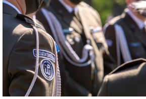
Przedstawiciele 4. Warmińsko-Mazurskiej Brygady Obrony Terytorialnej na powązkowskiej „Łączce” - 11 maja 2021.