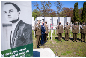
Przedstawiciele 4. Warmińsko-Mazurskiej Brygady Obrony Terytorialnej na powązkowskiej „Łączce” - 11 maja 2021.