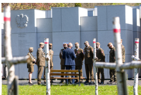
Przedstawiciele 4. Warmińsko-Mazurskiej Brygady Obrony Terytorialnej na powązkowskiej „Łączce” - 11 maja

Przed uroczystością przedstawiciele 4. Warmińsko-Mazurskiej Brygady Obrony Terytorialnej odwiedzili powązkowską „Łączkę”. O historii upamiętnienia opowiedział im zastępca prezesa Instytutu Pamięi Narodowej prof. Krzysztof Szwagrzyk.