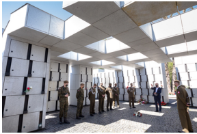
Przedstawiciele 4. Warmińsko-Mazurskiej Brygady Obrony Terytorialnej na powązkowskiej „Łączce” - 11 maja 2021.