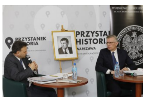
Dyskusja o książce „Gdański Grudzień '70. Rekonstrukcja – dokumentacja – walka z pamięcią”.