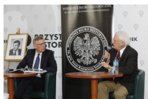
Dyskusja o książce „Gdański Grudzień '70. Rekonstrukcja – dokumentacja – walka z pamięcią”.