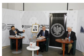
Dyskusja o książce „Gdański Grudzień '70. Rekonstrukcja – dokumentacja – walka z pamięcią”.