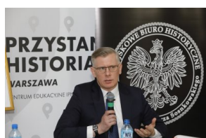
Dr hab. Sławomir Cenckiewicz.