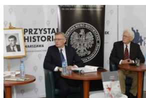
Dyskusja o książce „Gdański Grudzień '70. Rekonstrukcja – dokumentacja – walka z pamięcią”.