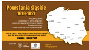
Ogólnopolska prezentacja wystawy „Powstania śląskie 1919-1921”.