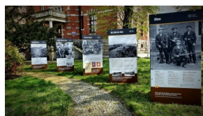
Prezentacja wystawy „Powstania śląskie 1919-1921” w