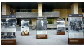
Poznań. Prezentacja wystawy „Powstania śląskie 1919-1921”.