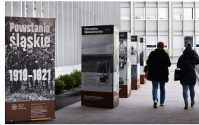
Kielce. Wystawa „Powstania śląskie 1919-1921”.