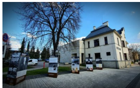
Wystawa „Powstania śląskie 1919-1921” w Jaworznie.