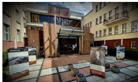
Białystok. Prezentacja wystawy „Powstania śląskie 1919-1921”.