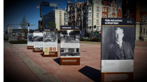
Prezentacja wystawy „Powstania śląskie 1919-1921” na katowickim Rynku.