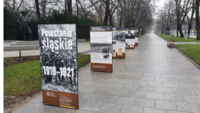
Prezentacja wystawy „Powstania śląskie 1919-1921” w Warszawie.