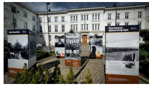
Wystawa „Powstania śląskie 1919-1921” w Bydgoszczy.