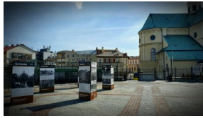
Prezentacja wystawy „Powstania śląskie 1919-1921” w Rzeszowie.