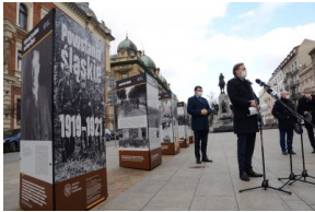
Otwarcie wystawy „Powstania śląskie 1919-1921” w Krakowie.