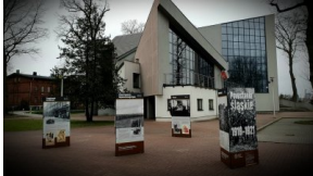
Wystawa „Powstania śląskie 1919-1921” w Zawadzkiem.